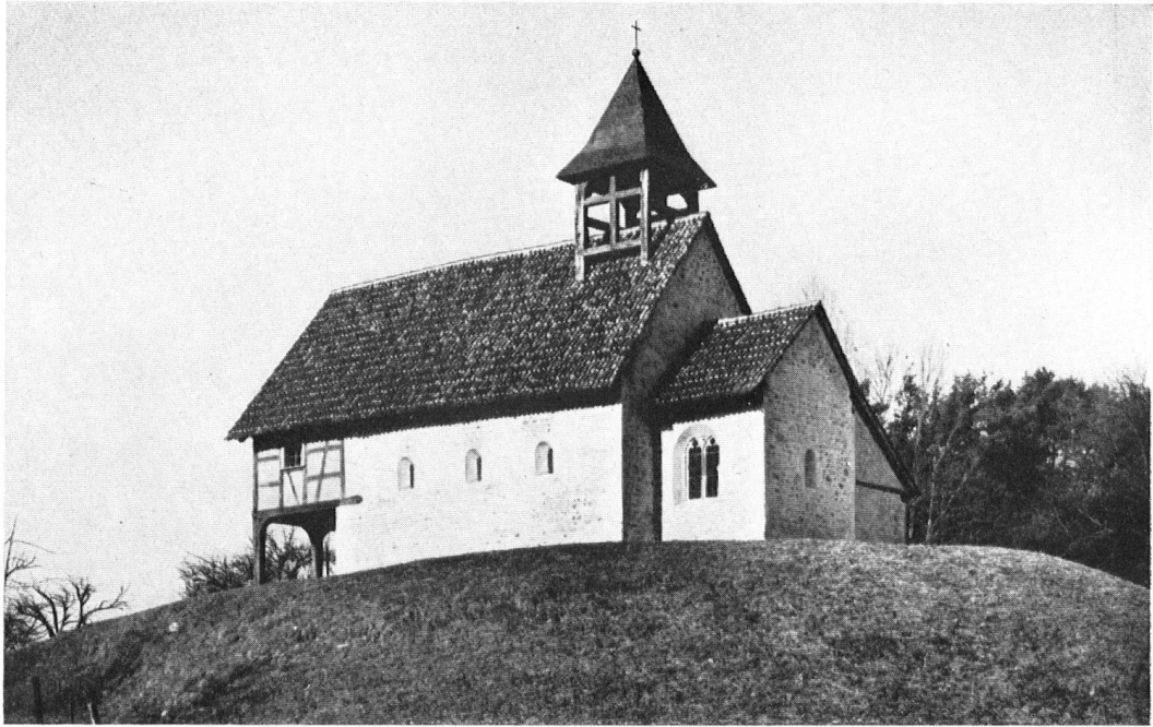
Die trefflich erneuerte Kapelle Degenau, die endgültig dem Verfall überlassen schien.