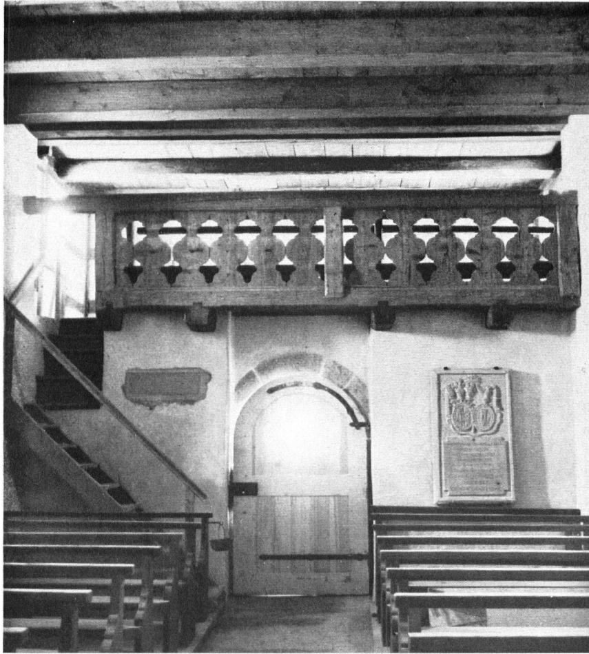
Kapelle Degenau heute. Blick gegen die Empore. Rechts die Grabplatte der Gräfin Thurn und Valsassina (Anfang 19. Jahrhundert).

ristische Opfer als unblutige Wiederholung des Kreuzestodes Christi fort und fort dargebracht wird.« «Die Figuren bewahren eine statuenhafte Ruhe . . . und werden durch die rahmende und zugleich trennende Gewalt der ragenden Säulen selber zu einsam ragenden Säulen der Kirche.« Zeitlich sind die Fresken dem ausgehenden 12. Jahrhundert zuzuweisen; stilistisch gehören sie in den Kunstkreis des Klosters Reichenau am Bodensee.