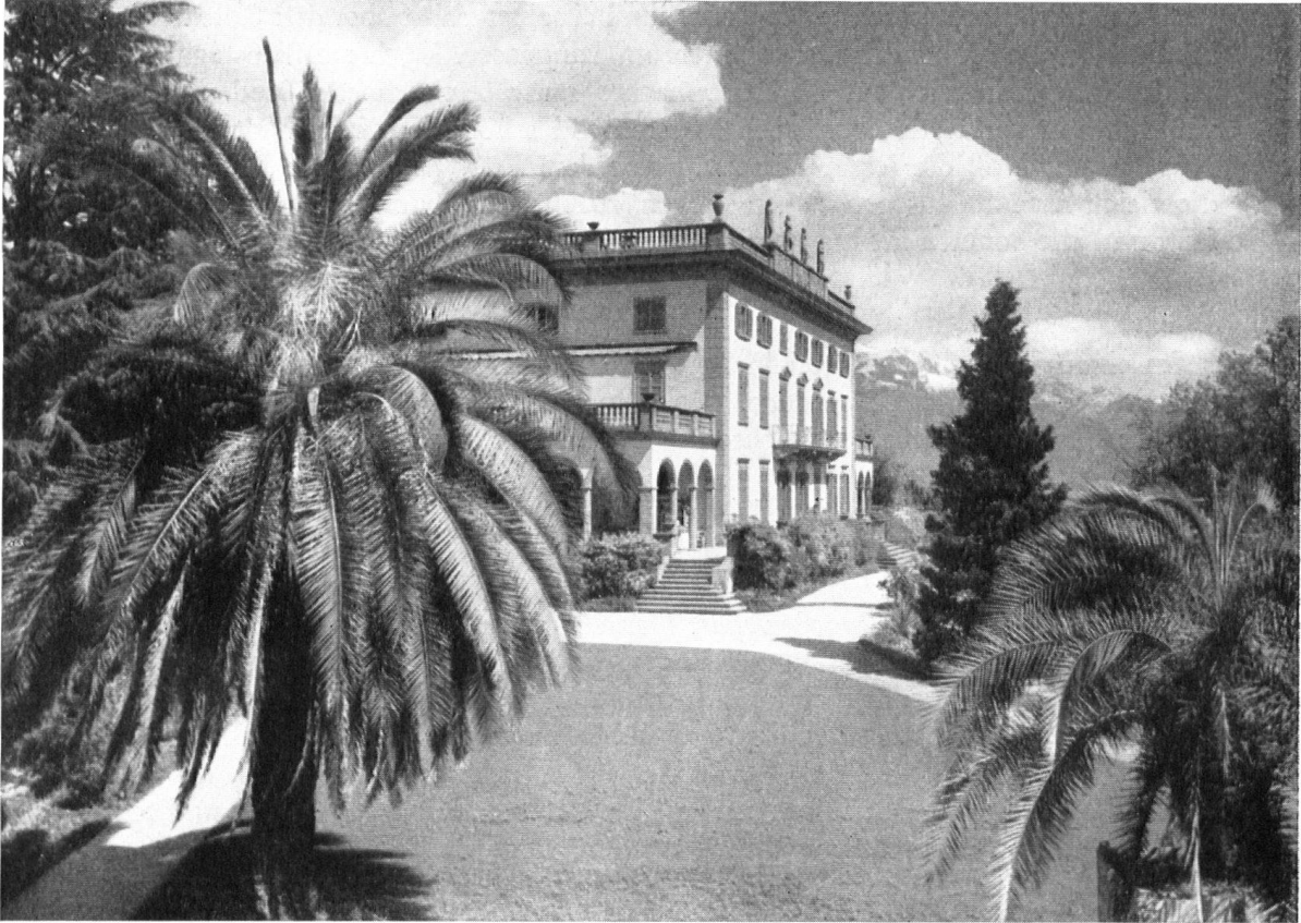
Das Herrenhaus auf den Inseln von Brissago, wo die Hauptversammlung des Heimatschutzes tagte. Es erinnert an das größte Talerwerk des Heimat- und Naturschutzes in den Jahren 1949/50. Einzelheiten siehe im letzten Heft dieser Zeitschrift.