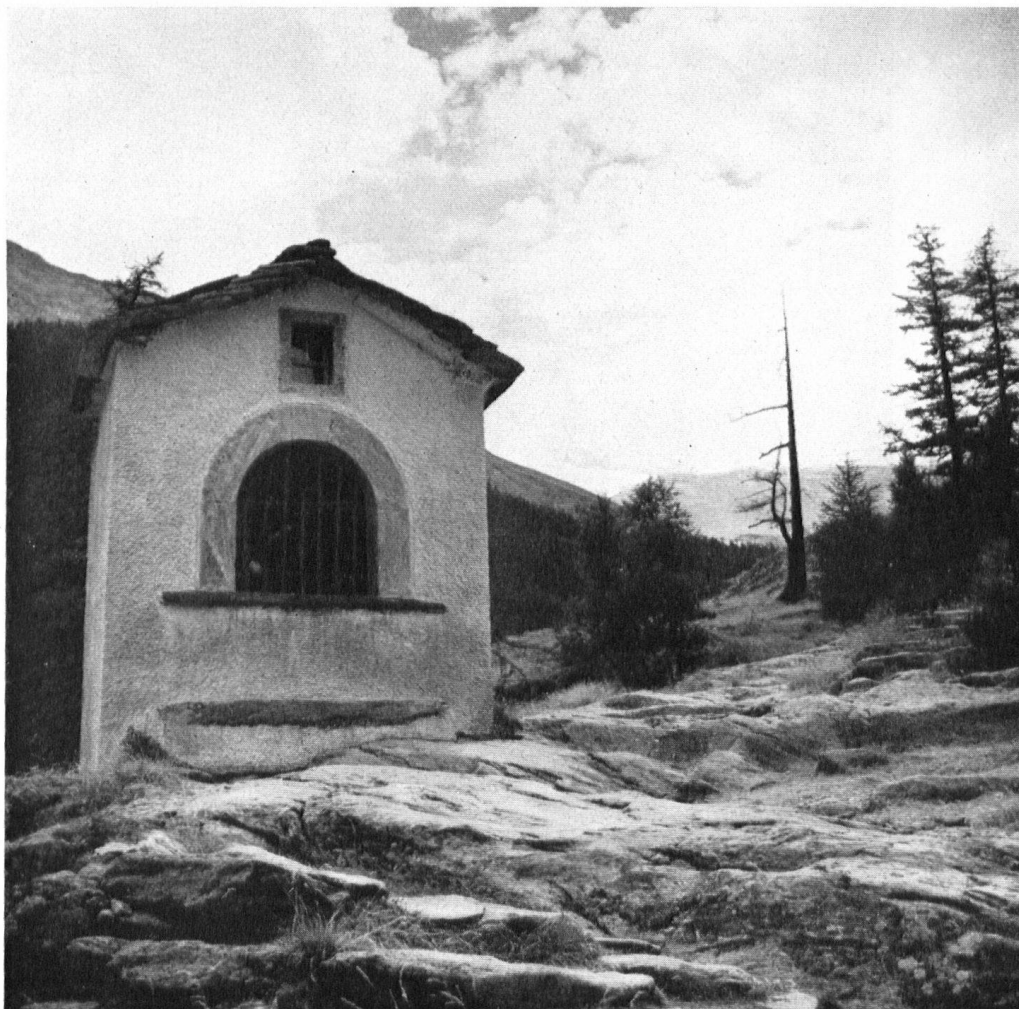
Die 15 Bildstöcke, welche die durch mehr als 100 Figuren dargestellten Geheimnisse des freudreichen, des schmerzenreichen und des glorreichen Rosenkranzes bergen, stehen unscheinbar am Weg. Die Bildstöcke sind um 1709 von verschiedenen Familien des Tales infolge eines Gelübdes gestiftet worden.

Finger wie bei der Reparatur der schadhaft gewordenen Gewandteile, Waffen, Nimbusformen usw. trefflich in die handwerkliche Kunst längst vergangener Zeiten einzufühlen.