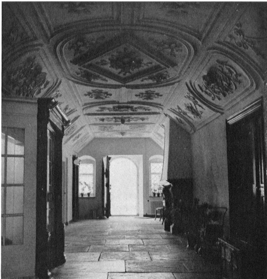
Der imposante Gang im Erdgeschoß mit seinen reichen Stukkaturen.