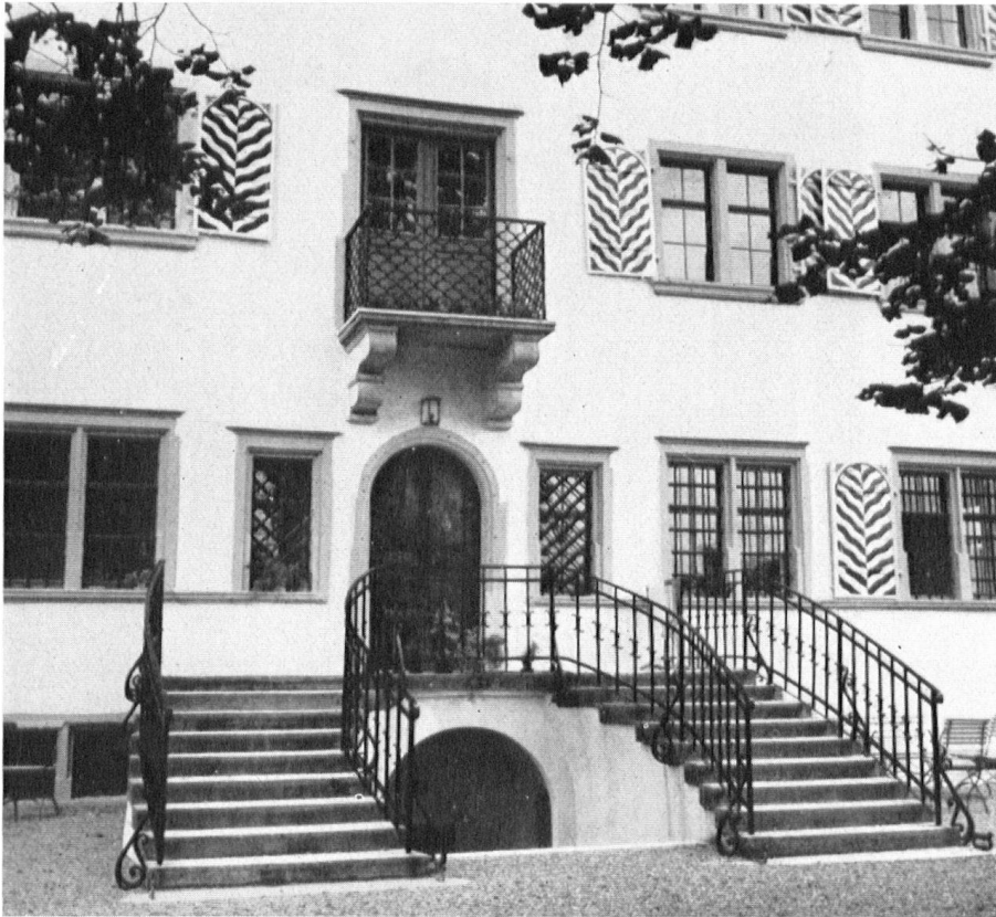
Die Freitreppe des Herrenhauses.