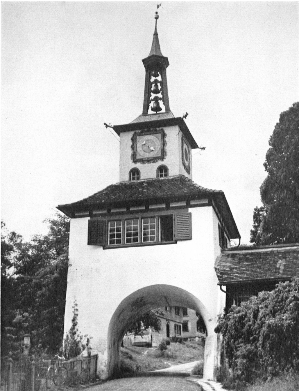
Das einzige Dorfstor der Schweiz beim Eingang zum Schloß Hauptwil, mit einer Uhr von Felix Bachofen, Zürich, 1672.