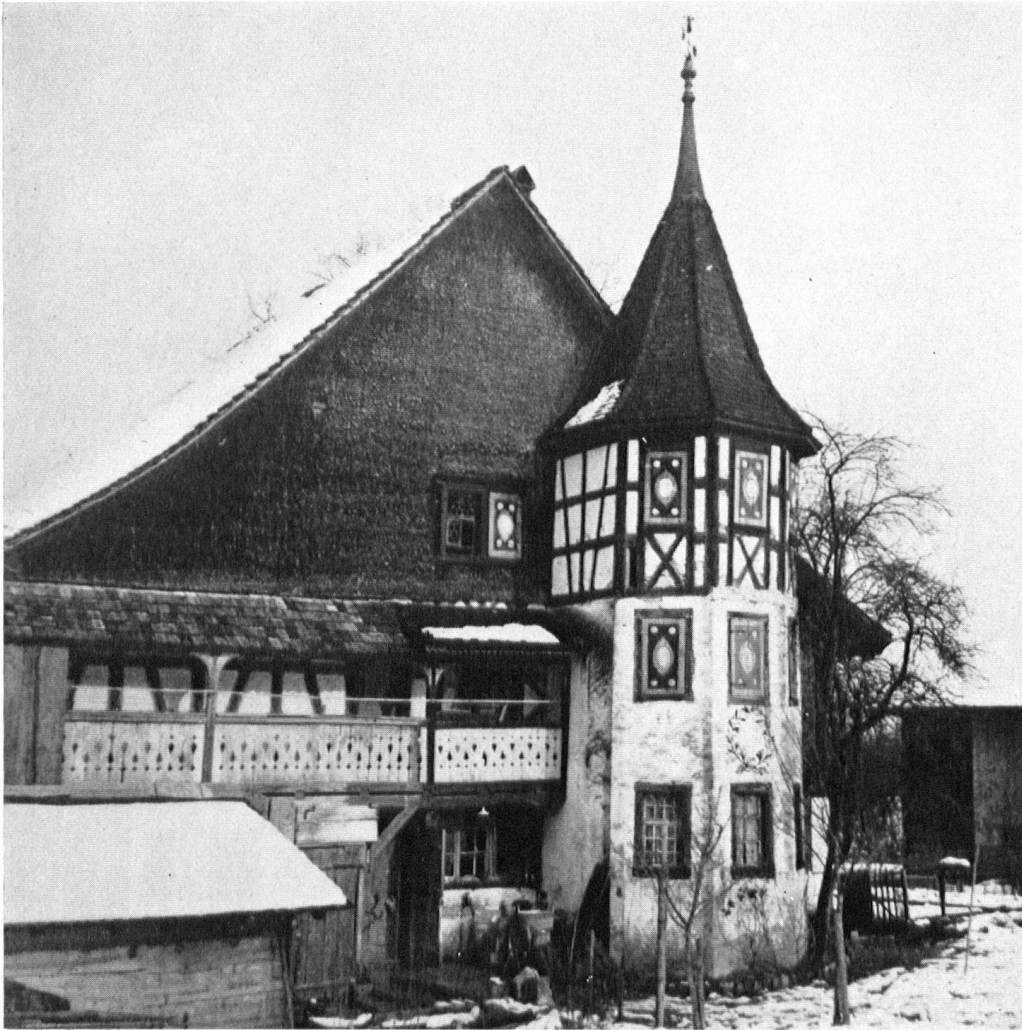
Längst waren die »Doktoren« ausgezogen und bescheidene Leute wohnten in dem Haus, die es nicht mehr zu unterhalten vermochten.