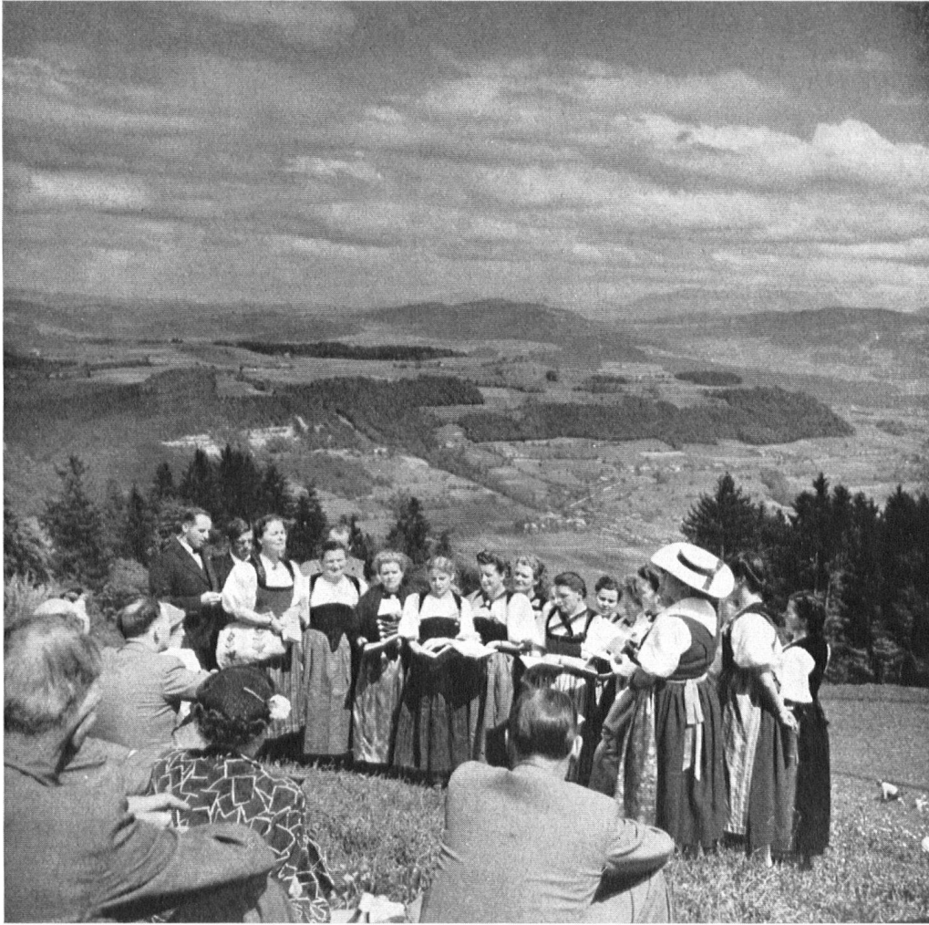
Au cours de leur visite au pays bernois, les protecteurs du Patrimoine national ont été accueillis partout de touchante façon. Au Längenberg, un chœur les attendait pour honorer avec eux la mémoire de l'écrivain dialectal Rodolphe de Tavel.