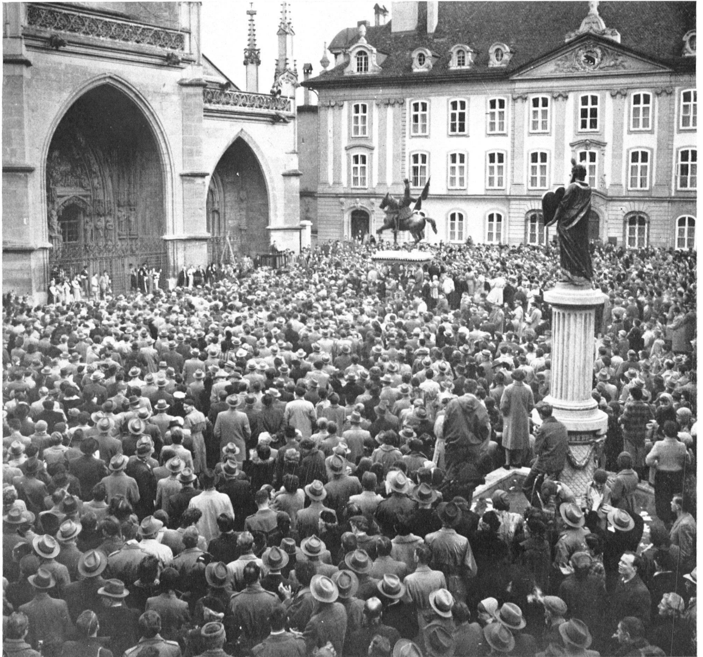
L'assemblée populaire du 6 mars dernier, à Berne, qui fut décisive pour le sort de la vieille ville et le maintien des maisons en arcades aux rues de la Justice et des Gentilshommes.