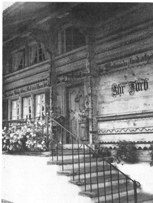
L'entrée est un modèle d'art rustique du gracieux XVIIIe siècle.