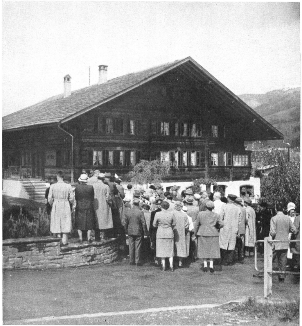
La halte devant l'un des plus beaux chalets peints de Frutigen, récemment restauré.