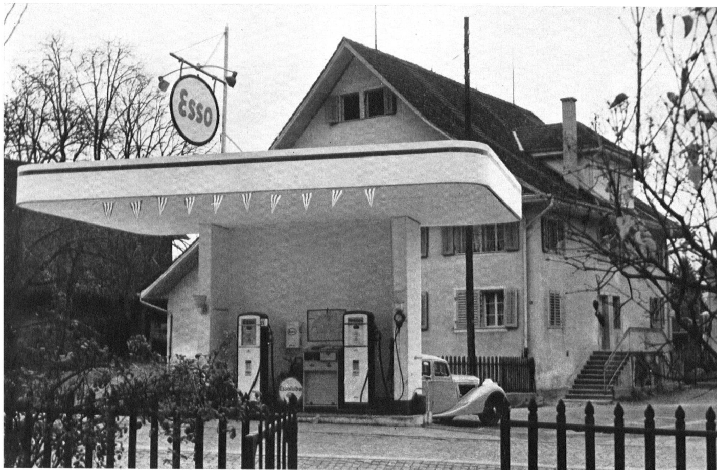
Prétentieuse verrue devant une maison bourgeoise de Suisse centrale (route Zurich—Lucerne). L'épaisseur de l'avant-toit n'est qu'un trompe-l'œil, fait d'une feuille de tôle.