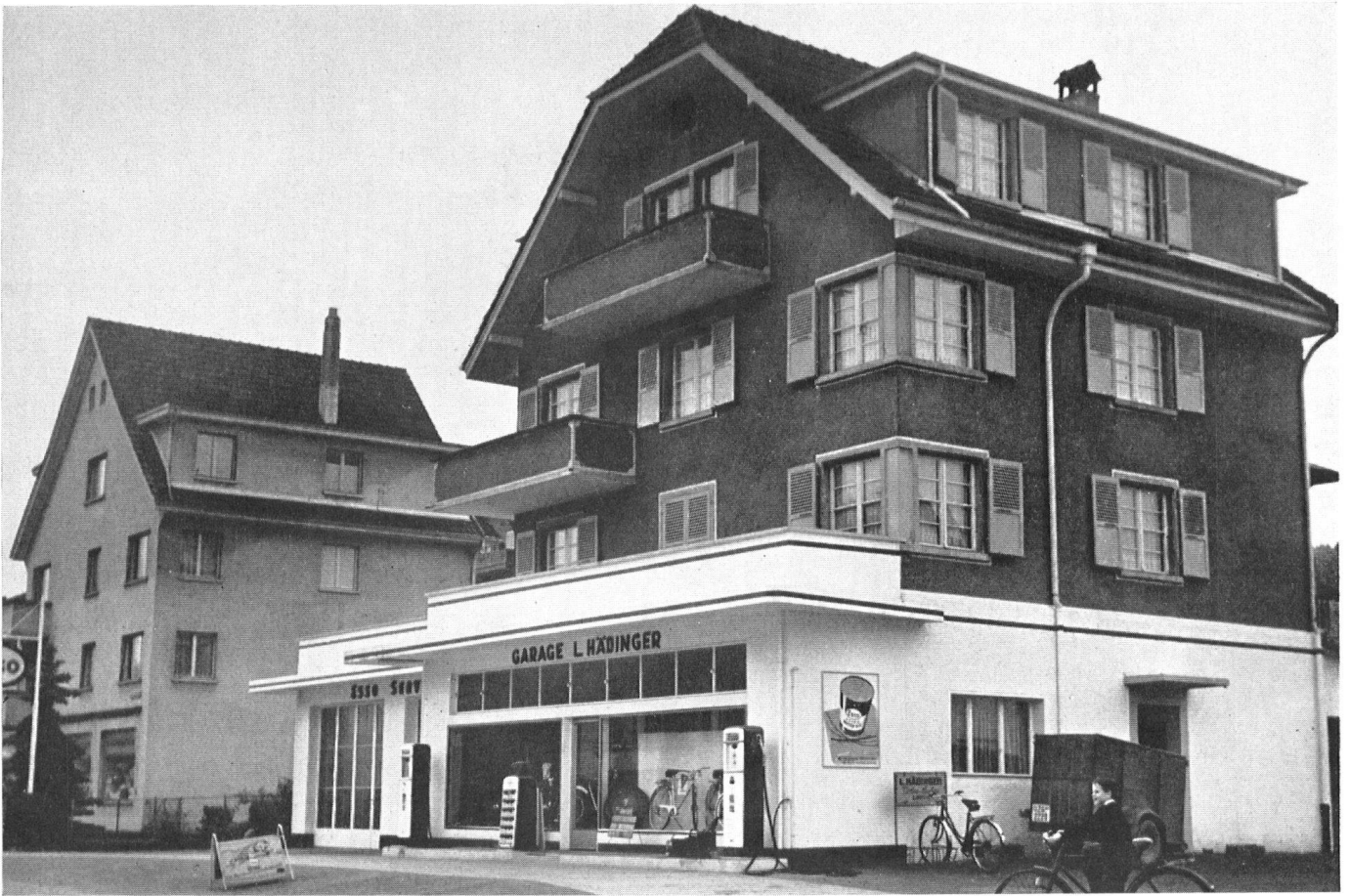
Les monstres présentés dans ces deux pages ont tous été photographiés entre Zurich et Lucerne. On a peine à comprendre qu'ils aient été admis par les règlements et les commissions d'urbanisme.