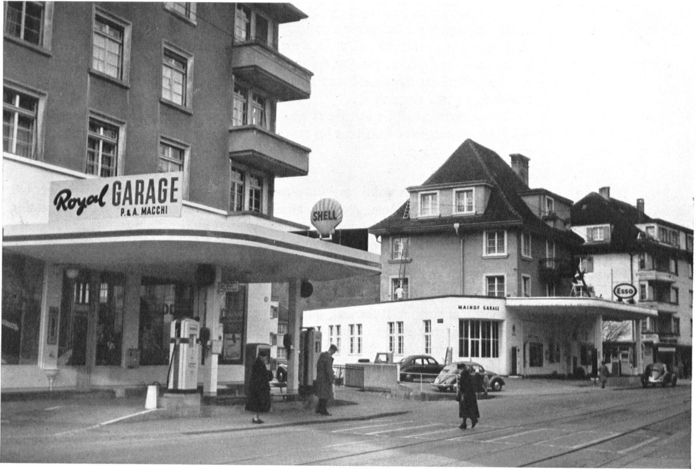
Il semble qu'on ait soulevé les maisons avec une grue, coupé leur base, pour y introduire les tranches d'un pâté douteux.