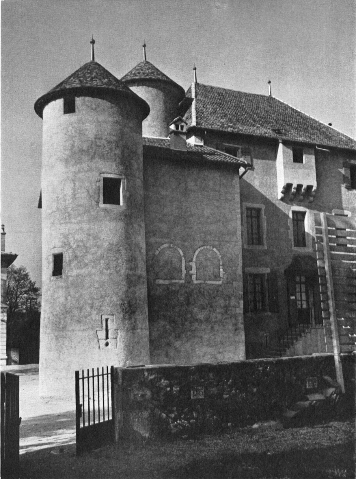
La tourelle a retrouvé ses justes proportions et celle qui abrite l'escalier en colimaçon surgit à nouveau.