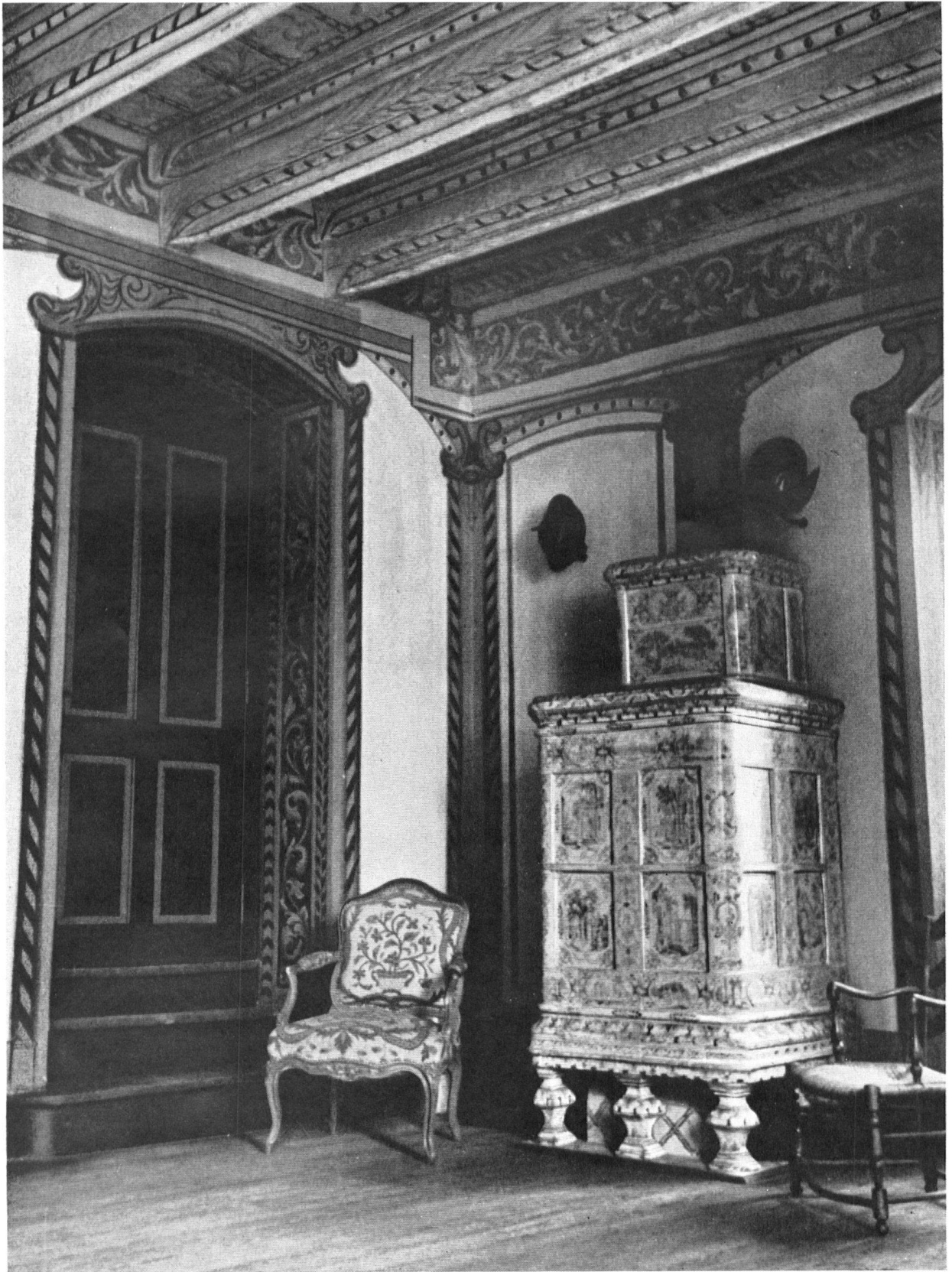
La salle des chevaliers de St-Jean, rénovée au XVIIe siècle, par le commandeur Cordon d'Evieu probablement, est digne désormais d'accueillir comme autrefois des visites illustres.