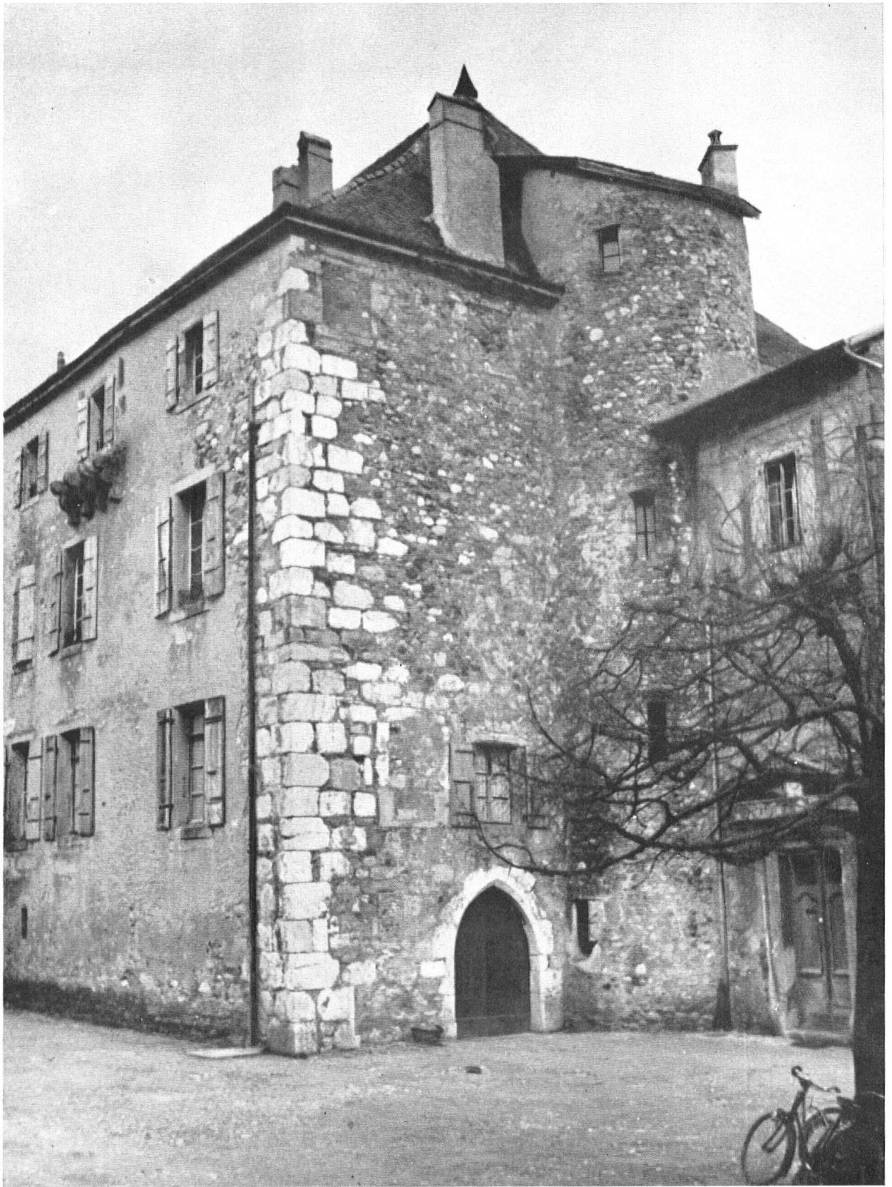
La Commanderie, où Berne installa son bailli de 1536 à 1567, fit retour à l'Ordre de St-Jean jusqu'à la Révolution et appartient aujourd'hui à la commune de Bardonnex.