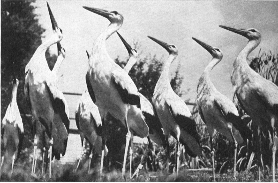
Les deux Ligues se sont accordées encore pour prêter secours à la station suisse d'ornithologie. Puisse l'accueil que reçoit les jeunes cigognes d'Altreu les inciter à nicher, comme naguère leurs parents, sur notre territoire (1953).

la Ligue pour la Protection de la Nature), la remise en valeur du Fextal, l'aménagement du Righi et des Chapelles de Tell, etc.