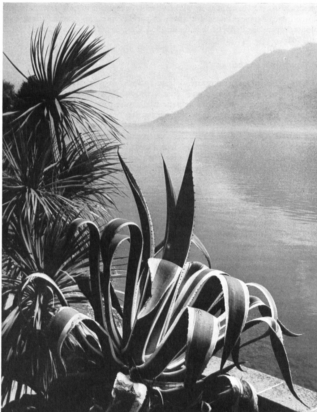
1950: achat, de concert avec l'Etat du Tessin et les communes riveraines, des îles Brissago, devenues le jardin botanique de la Suisse méridionale. Subside: 100 000 fr.

tions voient le jour, mais le Sésame se fait attendre et, vu sa brièveté, la forme un tantinet estropiée « Eimatschütz » est devenue courante chez nos amis romands.