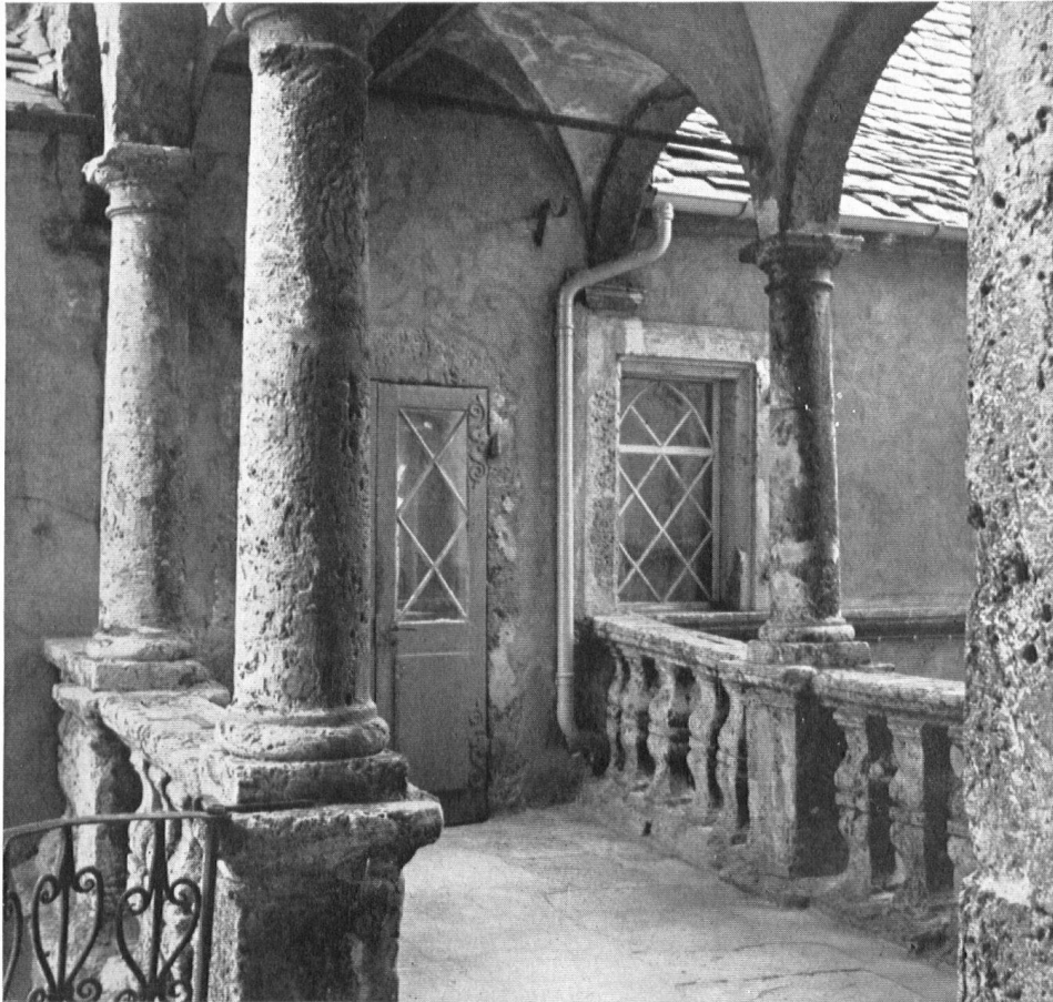
Die reizvolle Säulenbrücke zwischen dem alten und neuen Schloß ist vom Zahn der Zeit besonders schwer angefressen.