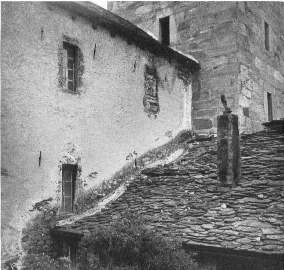
Ein Bild, das die Baufälligkeit der Dächer zeigt.