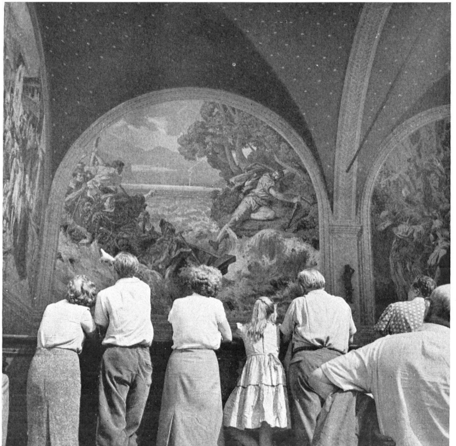
Heute: Besucher der Tellskapelle vor demselben Bild wie oben. Plus de rideau de fer pour les tou- ristes d'aujourd'hui!