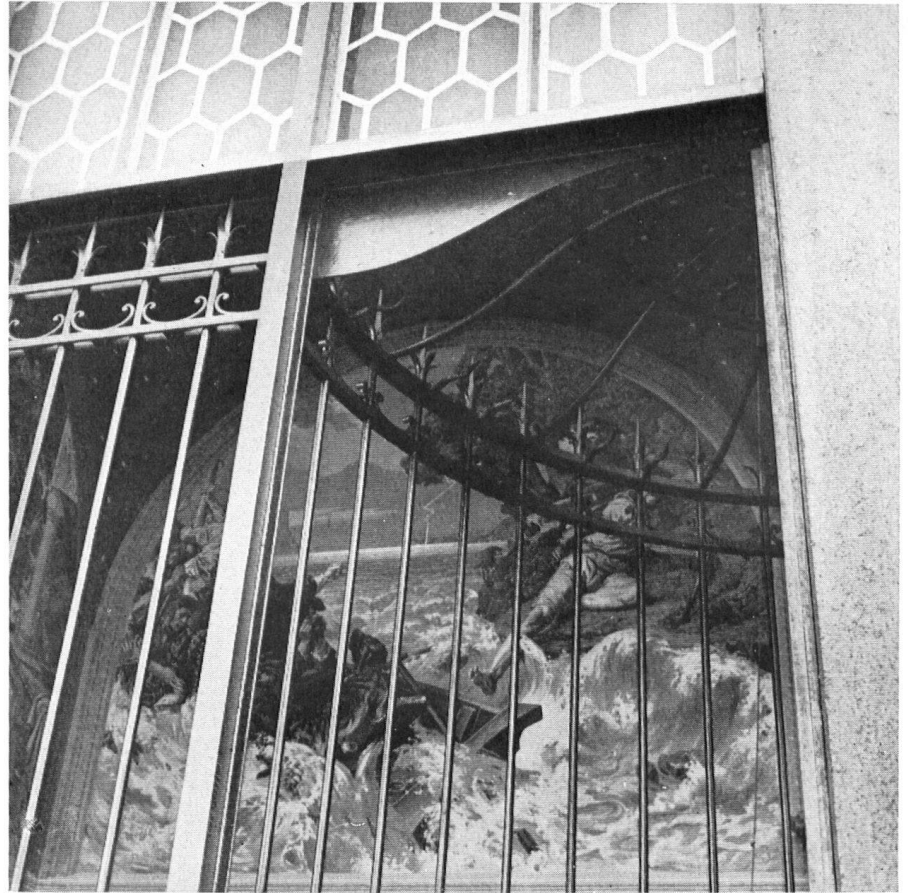
Wilhelm Tell hinter Schloß und Riegel. Guillaume Tell sous les verrous.