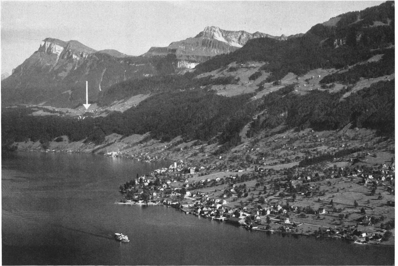
Das Dorf Beckenried, von dem aus die obere Straßenführung gegen Emmetten (Pfeil) hinaufginge.

sagte er: «So, junger Freund, und nun gehen Sie in diese stille Nebenstube und stellen Sie sich vor, Sie seien der Präsident des Obergerichtes. Wenn Sie dann dem Manne immer noch und nach bestem Gewissen vollkommen Recht geben können, dann nehmen Sie den Kampf für ihn auf . . . und wenn es bis vor das Bundesgericht geht. Liegt aber ein Teil des Rechtes bei der Gegenseite . . . dann suchen Sie einen Vergleich zu machen. Ist der Handel jedoch völlig faul, dann schicken Sie Ihren Mann nach Hause. Ich selber halte es so und fahre gut damit.»