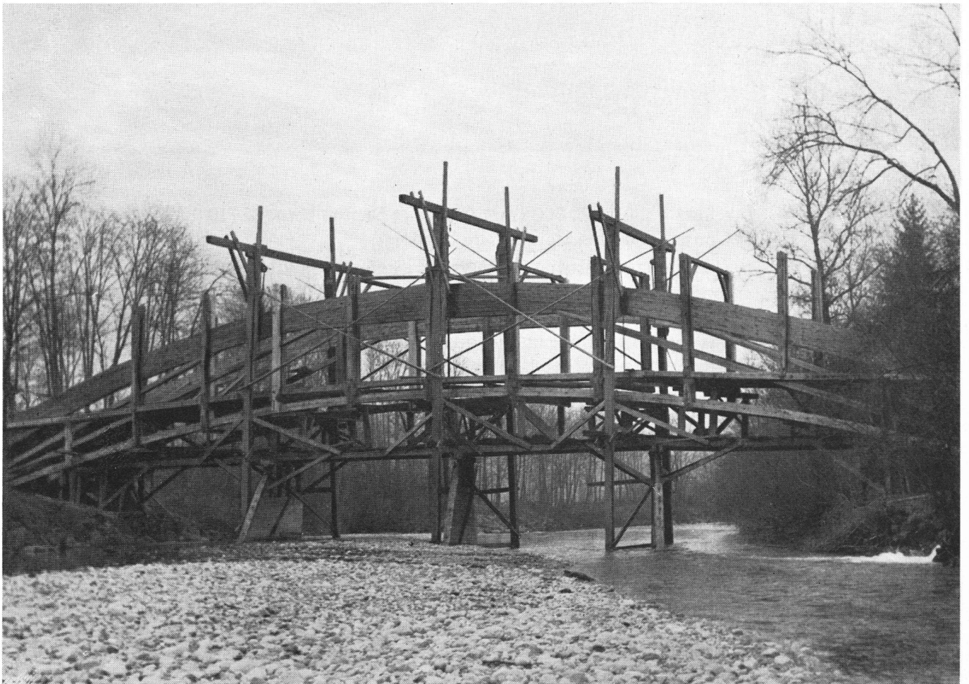
En haut: Le pont de Hasle-Ruegsau en son emplacement primitif.