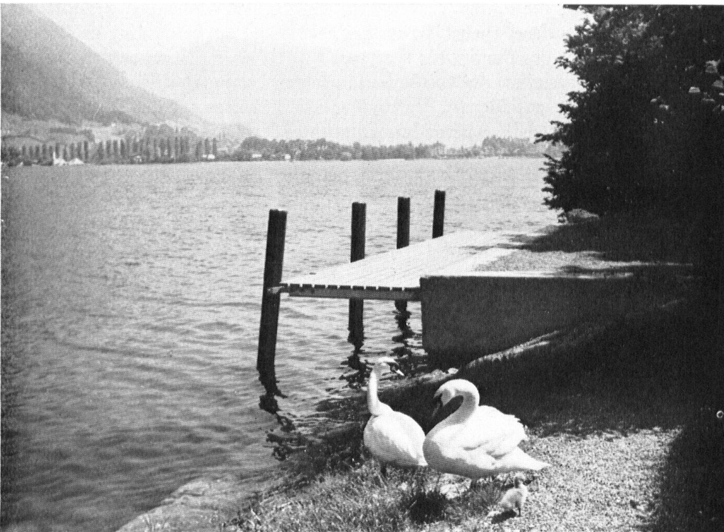
An Stelle eines alten, häßlichen, nunmehr verschwundenen Holz- und Landeschuppens steht heute dieser idyllische kleine Schiffsteg.