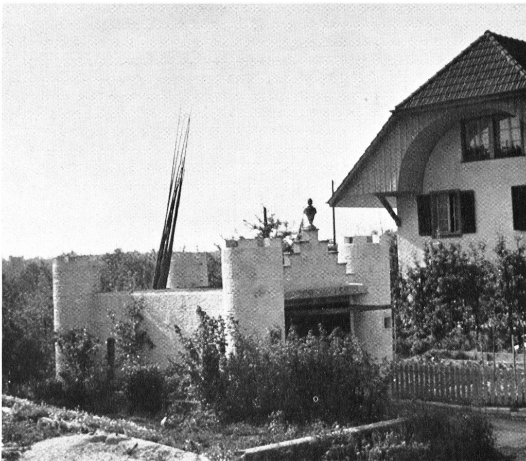
Berner Ritterbürgli als Autoschopf.