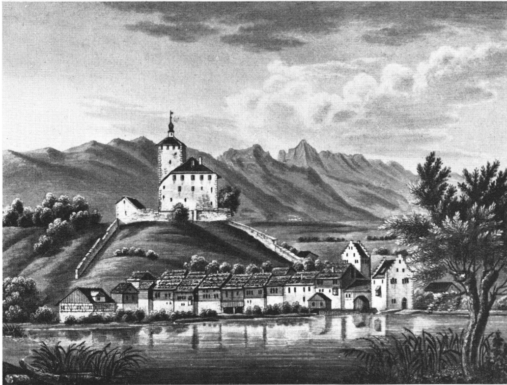
Werdenberg au début du XIXe siècle, d'après une aquatinte appartenant à la Bibliothèque centrale de Zurich.

enseigne à la Landsgemeinde du comté. Le fanion fut conservé au château; on le remettait au banneret en cas de guerre, et, quand s'apaisait la tourmente, il réintégrait le castel.