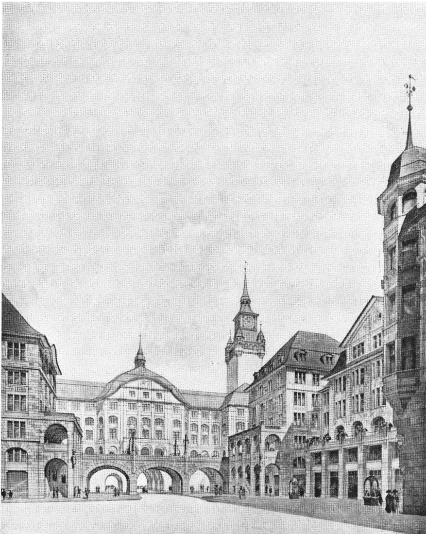
Vue de la « Bahnhofstrasse » (« Werdmühleplatz ») en direction de la Limmat. Les deux bâtiments reliés par un pont ont été construits et existent encore; par bonheur, ce ne fut pas le cas du gigantesque palais avec tour, tourelles et clocheton. Cet emplacement est occupé par le jardin qui s'étend de l'ancien orphelinat au « Heimethuus ».