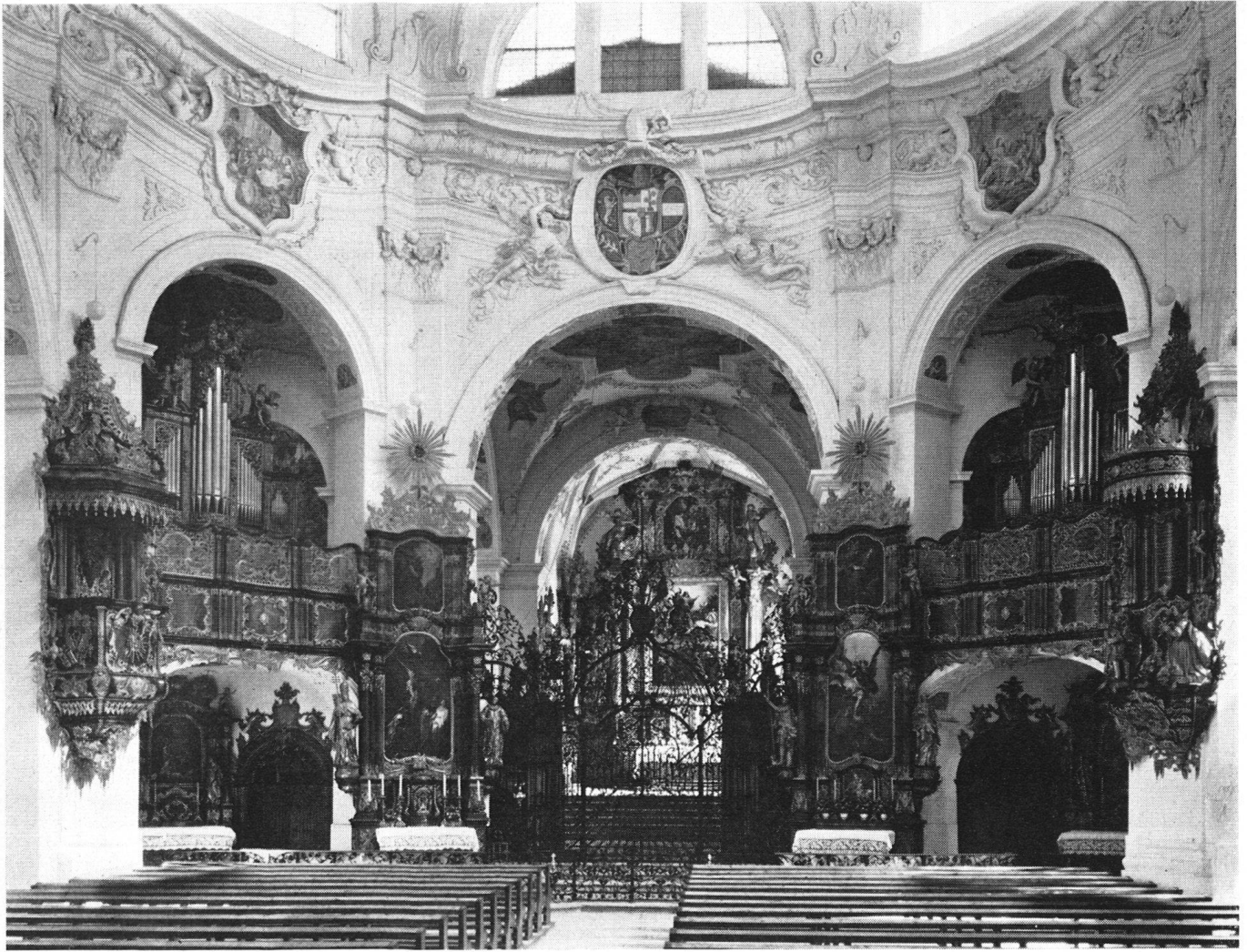
Eglise abbatiale; intérieur, sous la coupole octogonale, exécutée d'après les plans de P. Gaspard Moosbrugger (1694).