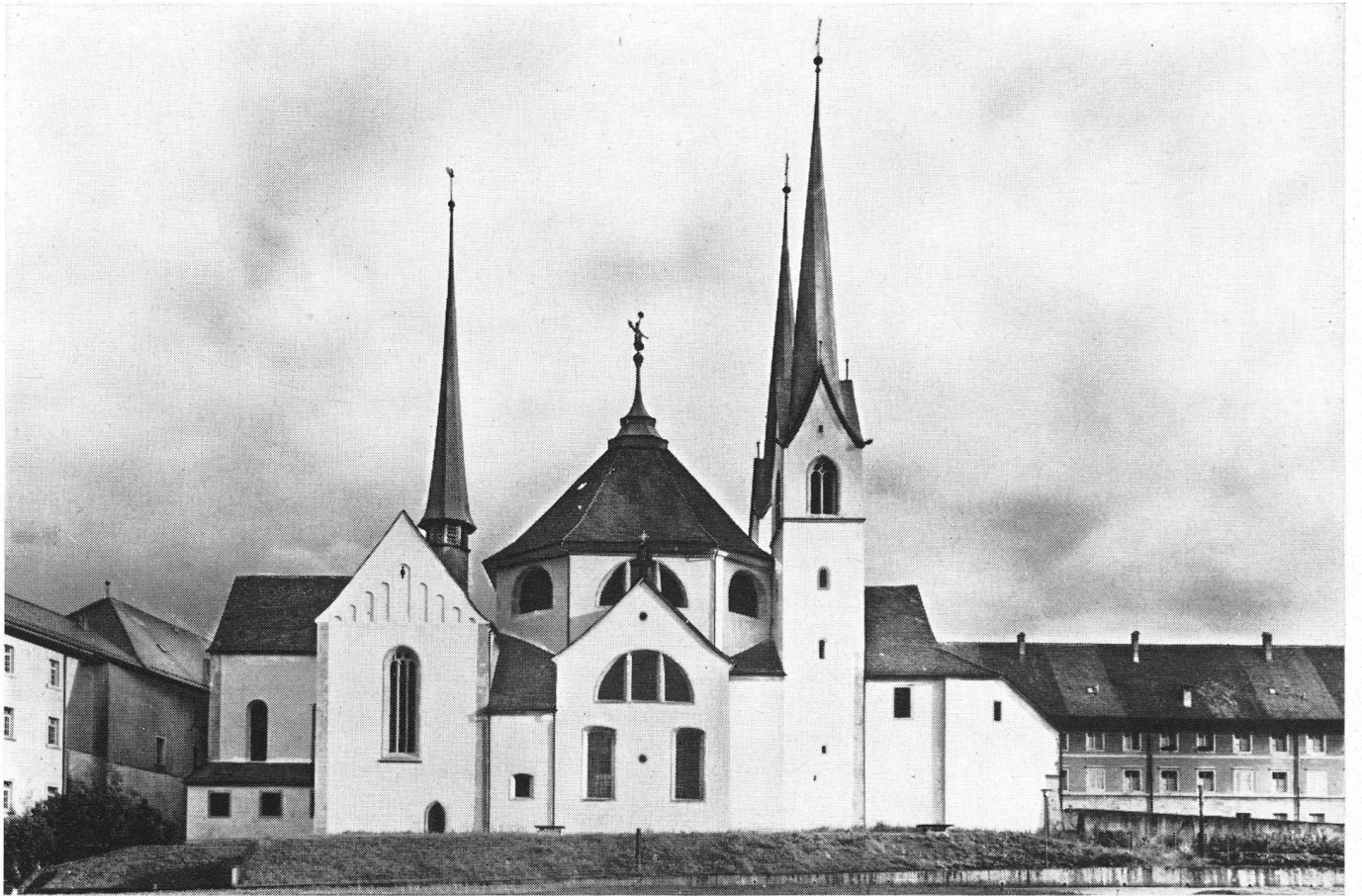
Eglise de l'ancienne abbaye bénédictine de Muri en Argovie, appartenant aujourd'hui à la paroisse catholique romaine. Vue prise du nord. — En bas: L'écran que constituerait le bâtiment projeté par la commune.