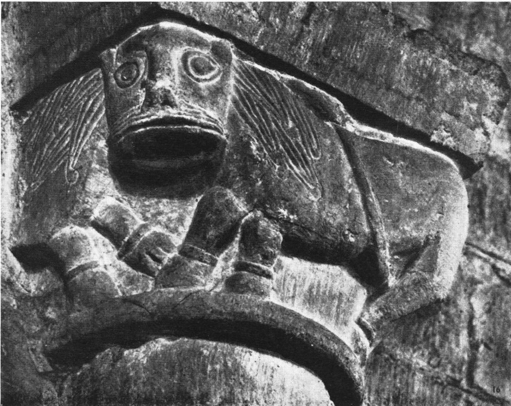
Eglise de Grandson (Vaud). Un chapiteau: lions à tête unique