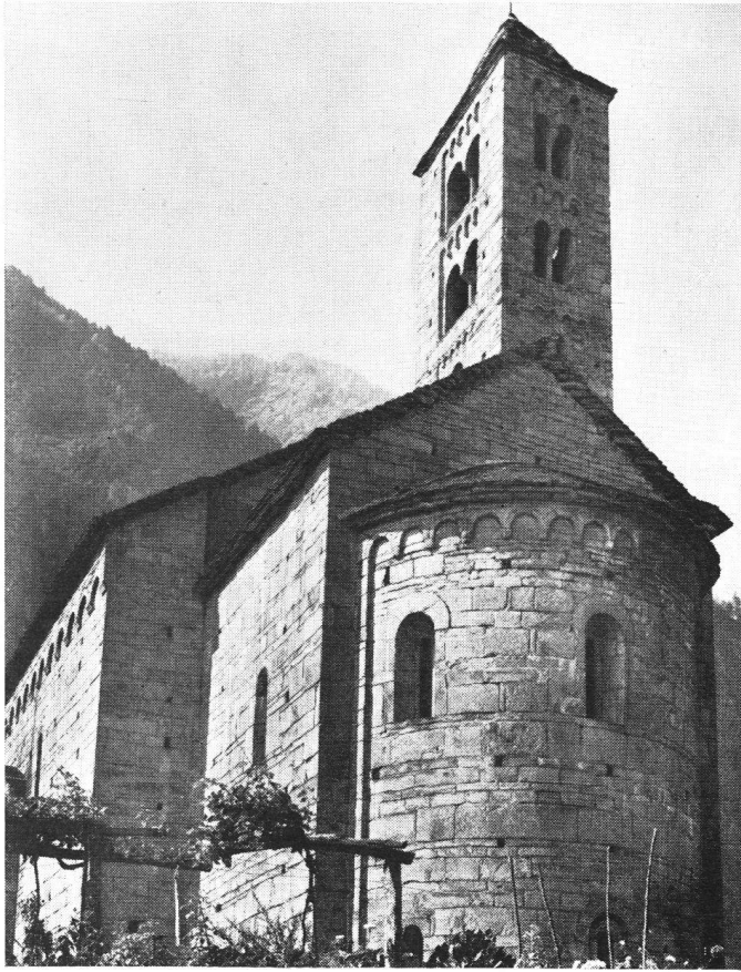
Giornico (Tessin). Eglise de Saint-Nicolas