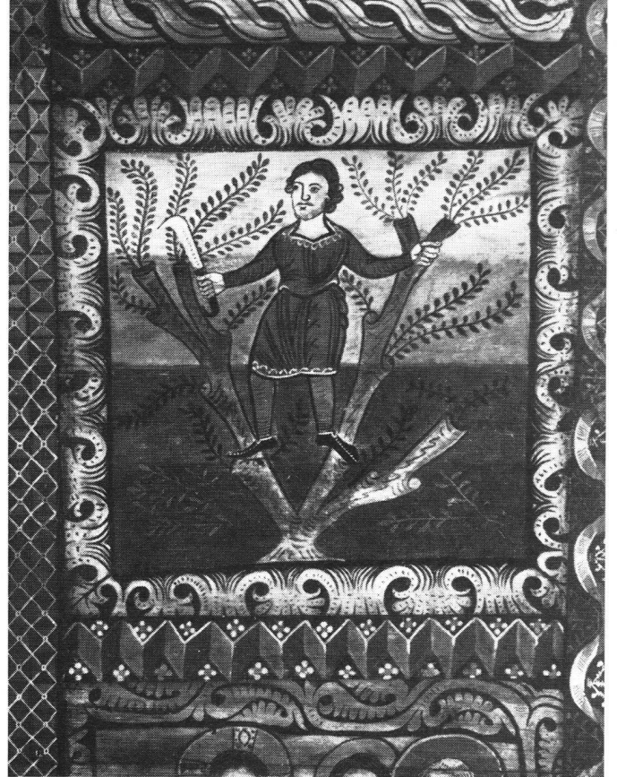
Zillis (Grisons). Un des 153 panneaux peints du justement fameux plafond de l'église: un coupeur de rameaux. (Evang. de Jean 12, 13.)