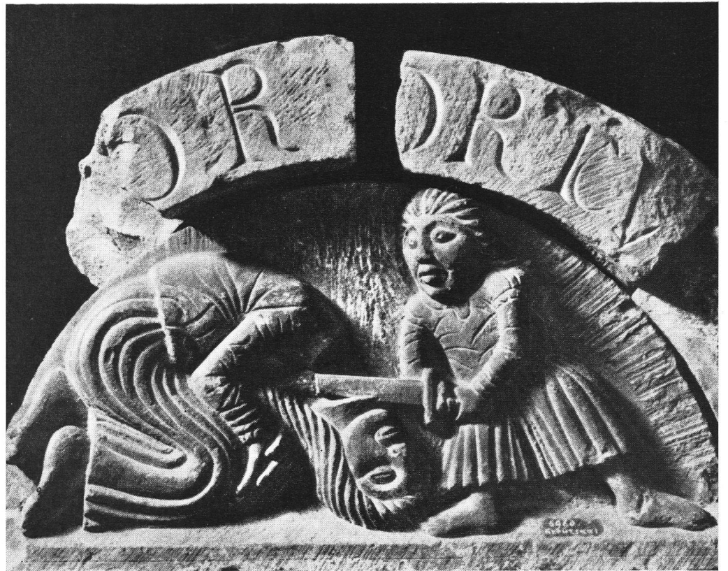
Schaffhouse. Musée de Tous-les-Saints. Scène de décapitation