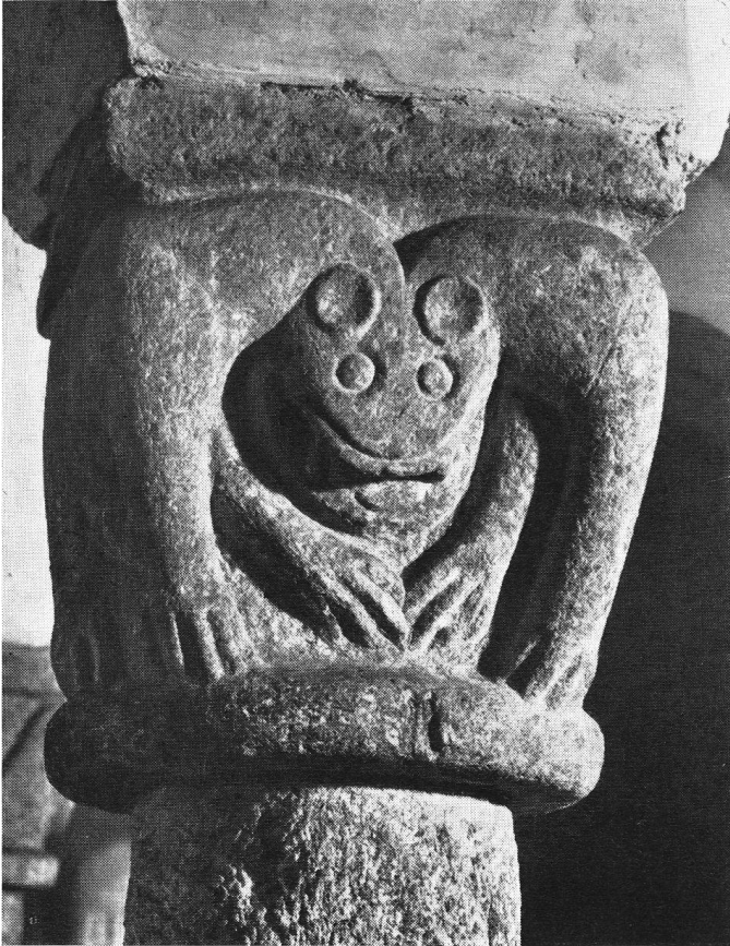
Giornico. Crypte de Saint-Nicolas. Un chapiteau: animaux à tête unique