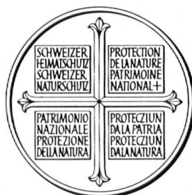
Der Taler 1964 von Carl Fischer (Herrliberg)