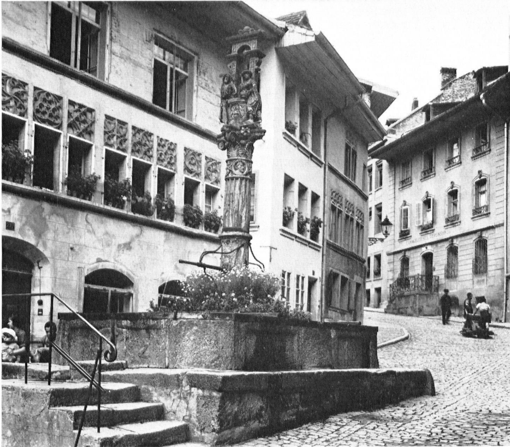
Seite 96 oben: Die sogenannten Gerberhäuser in der Unterstadt.