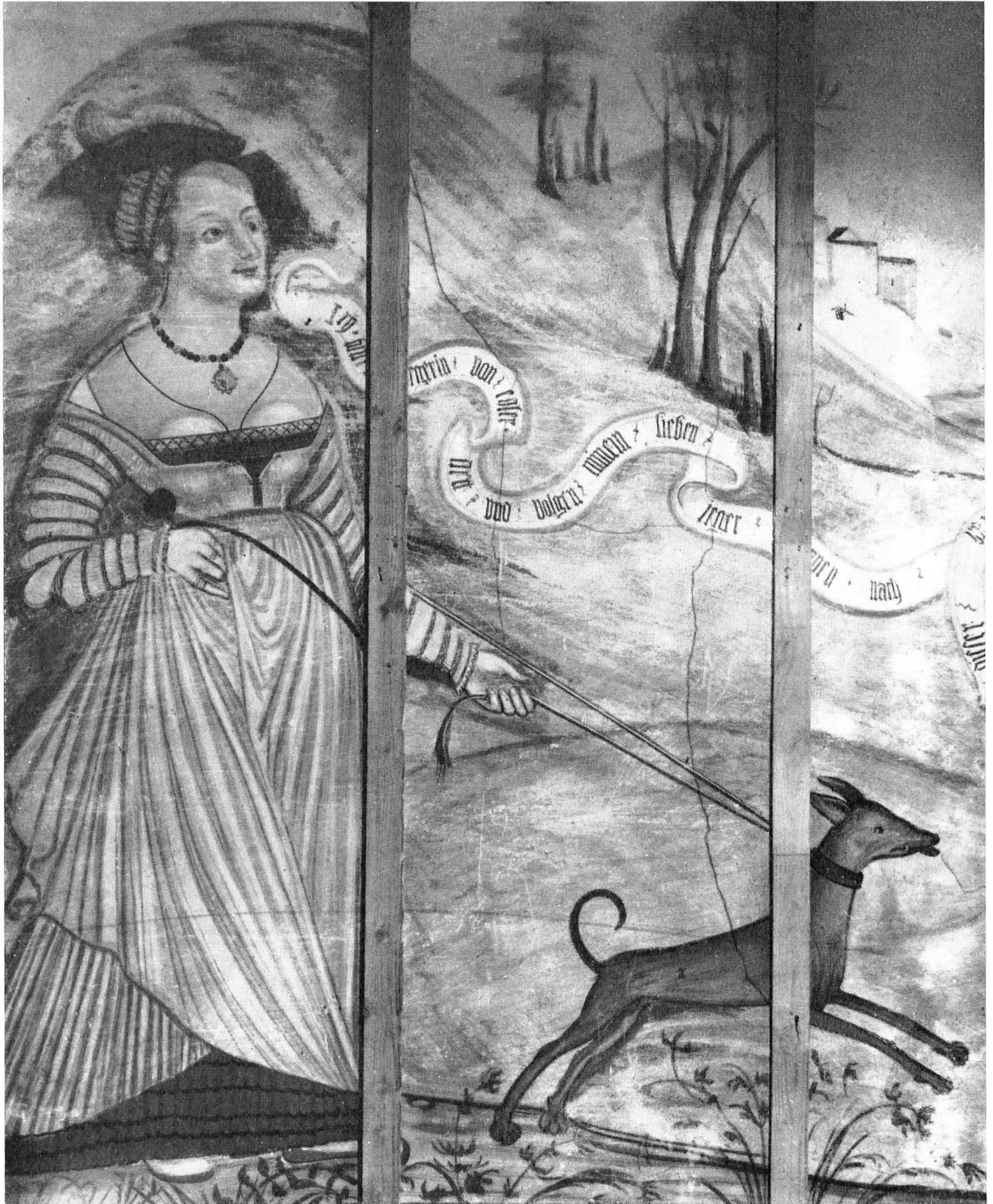
Auch im Innern der Häuser verbergen sich zahlreiche Kostbarkeiten: Reiches Getüfel, geschnitzte und gemalte Stubendecken, Öfen mit Bildkacheln, Wandmalereien usw. Die Freske, die wir zeigen, ist ein Ausschnitt aus einer großen Treibjagd aus der Mitte des 16. Jahrhunderts, welche den Saal des Hauses Techtermann an der Zähringerstraße schmückt. Die Instandstellung des zwölf Meter langen kostbaren Bildes wäre dringend erwünscht. Das bis vor kurzem von Schwestern bewohnte Haus steht heute leer und sucht einen Käufer! Für 150 000 Franken! „Pro Fribourg“ gibt gerne Auskunft.