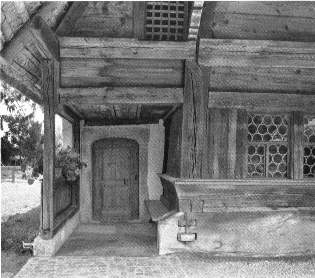
Der zum Glück durch den Brand kaum beschädigte Wohnteil des Hauses, wie er sich heute darbietet. Die alten Butzenscheiben sind wieder eingesetzt.