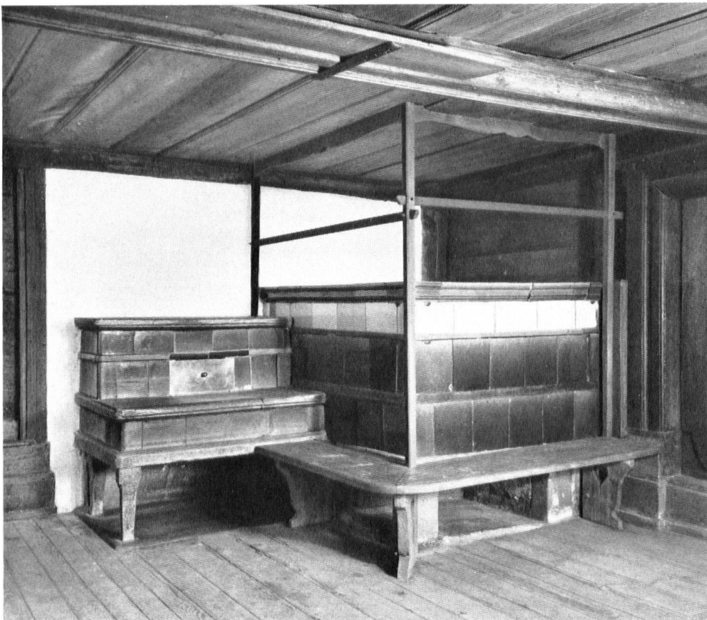
Die gemütliche Wohnstube mit dem Brotbackofen und der Sitzkunst (Chouscht).