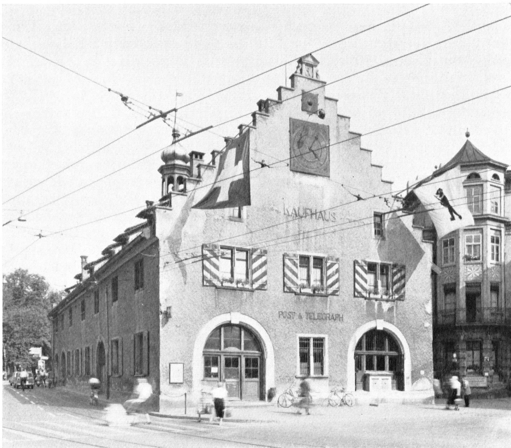
Façade ouest avant la restauration. Mauvaise structure architecturale. Au rez-de-chaussée quelques verrues. Crépi grisâtre et écaillé.