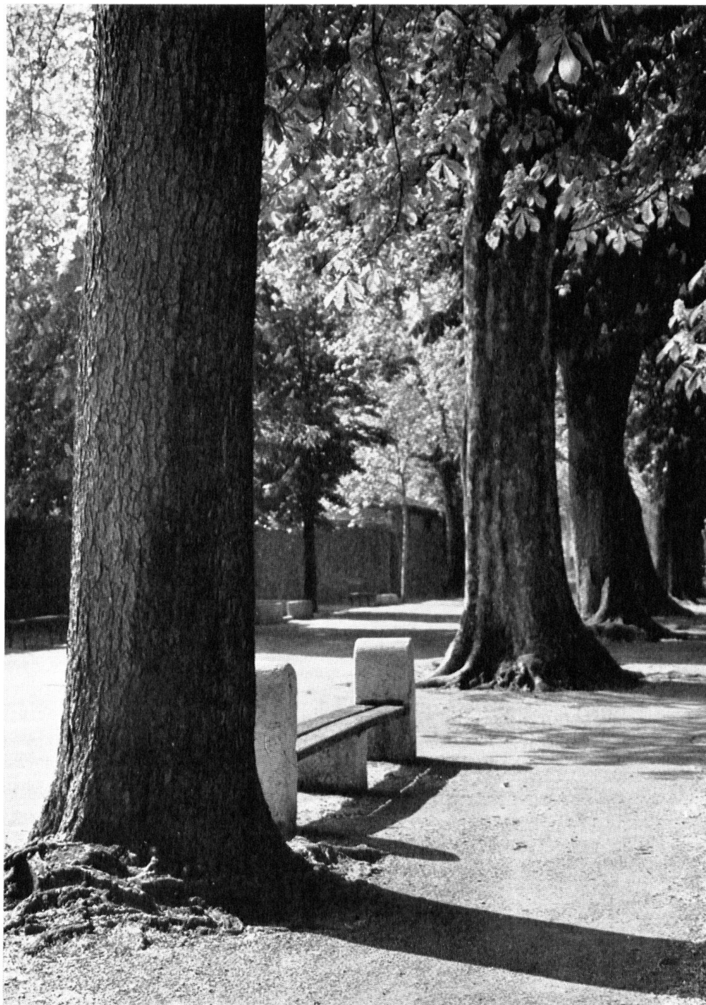
« Les Promenades ». Le long du canal récemment supprimé qui servait d'enceinte à Carouge du côté de l'ouest et du nord, on planta des peupliers en 1784. Ils furent abattus sous l'Empire, lors d'un hiver rigoureux. Les remplacèrent deux rangs de platanes et de marronniers qui, superbes, subsistent.

banque sur la place de la Collégiale de Bellinzone (encadrée de maisons patriciennes baroques) nous incite à la prudence.