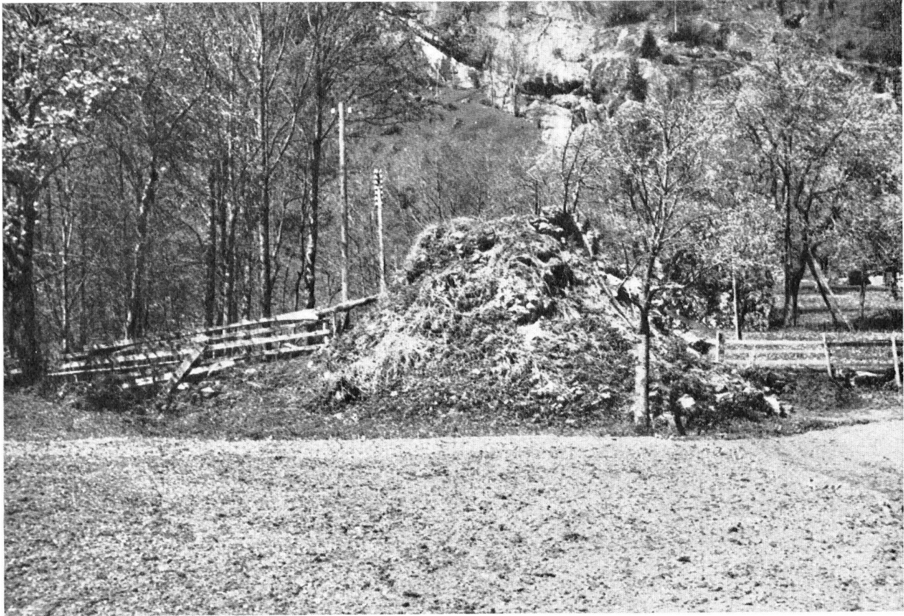
Einem Schutthügel ähnlich, erhoben sich die Reste des Schmelzofens vor der Restaurierung. Unter dem Boden, bis in 3 m Tiefe, war die Umfassungsmauer jedoch vollkommen intakt, ebenso der einstige Ofenschacht in der Mitte.