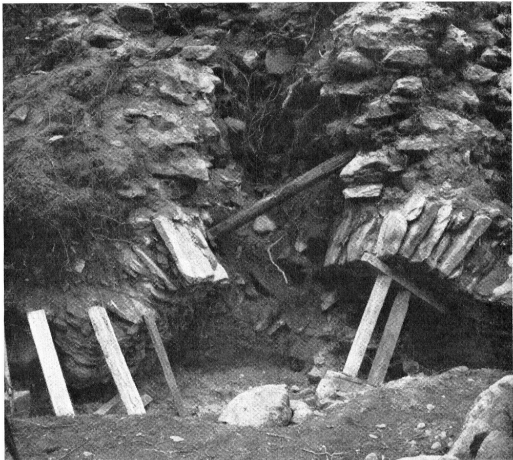
Die Abstichöffnung, wie sie sich bei der Freilegung präsentierte.