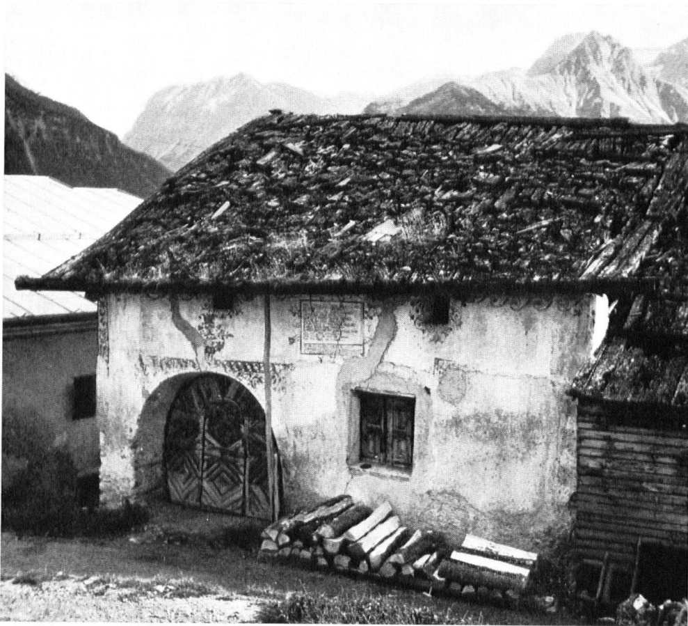
Dans le même village une autre maison menaçait ruine. Un joailler bâlois en fit l'acquisition, la restaura et l'utilise comme maison de vacances.