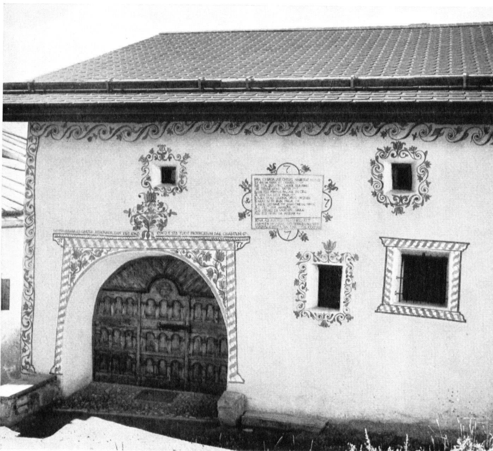
La façade rénovée. Décorée dans le style traditionnel de la Basse-Engadine, où se sent l'influence du Tyrol tout voisin. Architecte: Constant Könz, de Zuoz; subside du Heimatschutz. Puisse cette restauration susciter des imitateurs!