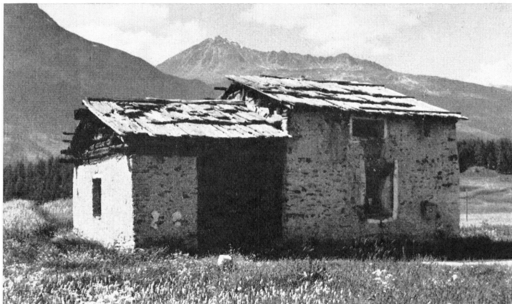
« Saalhaus » surélevé, à Surlej près de Silvaplana. Inhabité, en péril.