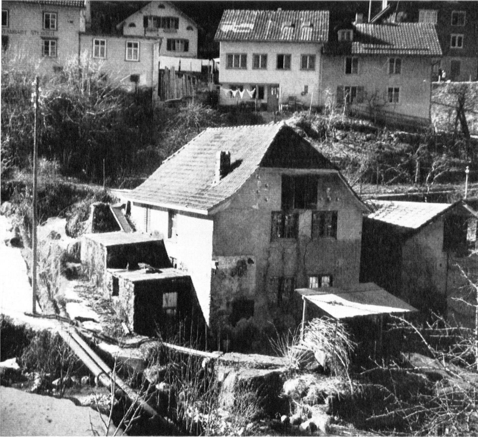
Telle était la forge... Restauration exécutée avec l'aide de la section glaronaise et de la Ligue suisse.