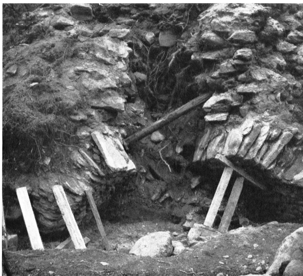
L'une et l'autre vues présentent l'état des lieux avant les travaux.