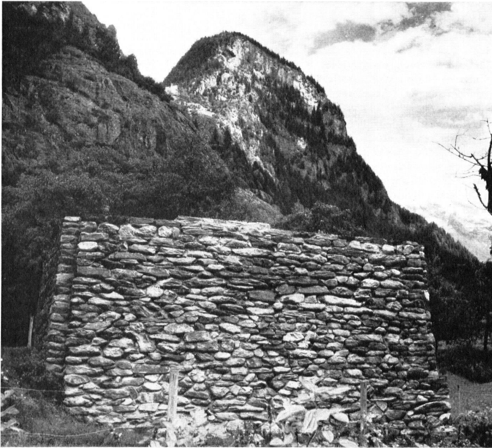
Un autre aspect du four à métaux reconstruit.

En 1762 et 1834, le forge d'Amsteg, ainsi qu'une partie des fours de Bristen et d'Obermatt, furent anéantis par les inondations. Un seul bâtiment, à une demi-heure de marche de Bristen, résista à ces catastrophes et brava les siècles: la Schmelzi , dernier témoin historique de cette ancienne industrie uranaise. Il aurait cependant disparu sous les broussailles, comme n'importe quelle ruine oubliée, si on ne l'avait tiré de sa dangereuse léthargie. Avec l'appui financier de la Ligue suisse du patrimoine et de sa section de Suisse centrale, une remarquable restauration a été menée à chef au cours de l'année 1966. D'une butte informe est sorti un imposant polyèdre de pierres sèches, avec une superbe voûte à l'entrée du four. Aucun document ne donne de renseignements sur la superstructure de cet ouvrage. En revanche, des fouilles dans les environs permettraient probablement de retrouver les traces des ouvrages annexes (roue à aubes, soufflerie, laverie, etc.), et fourniraient surtout des renseignements sur le processus des opérations de fonderie.