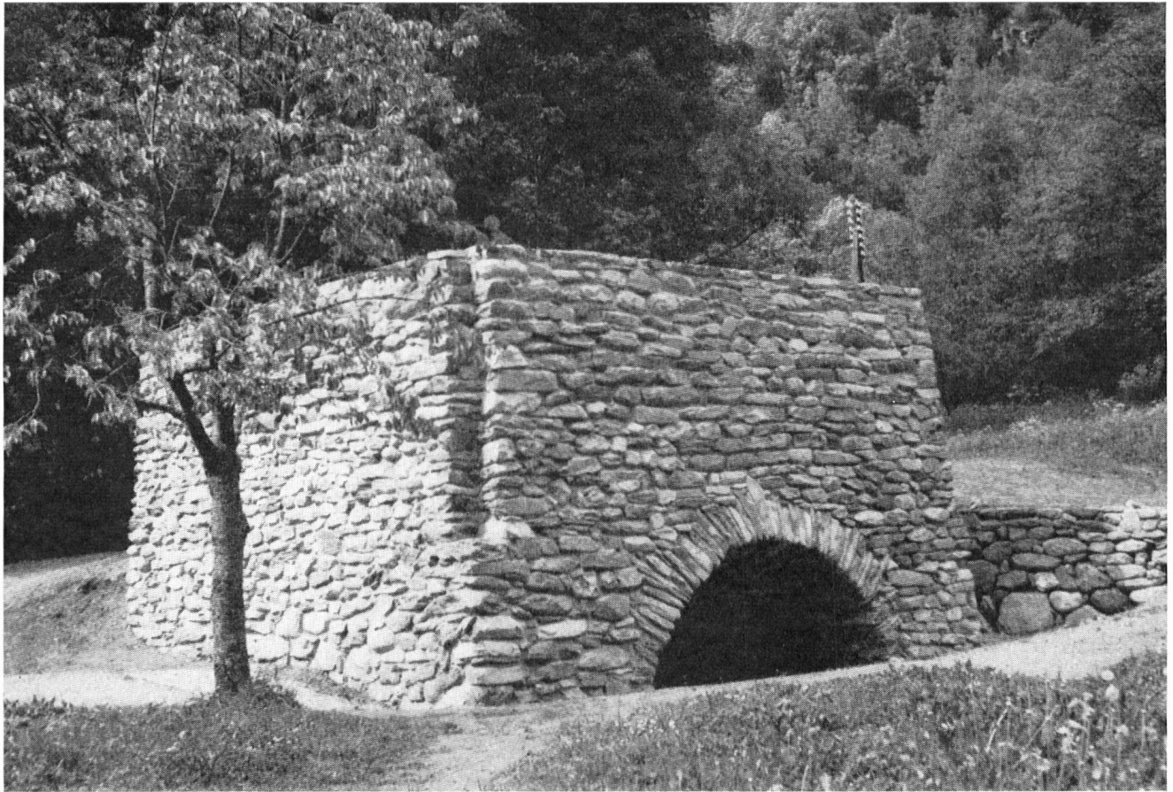
Vue d'ensemble du four reconstruit.