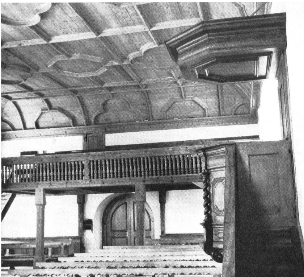
Cette église, dont l'intérieur a bénéficié d'une restauration excellente, tient un rang très honorable dans la série des monuments d'art du Jura.