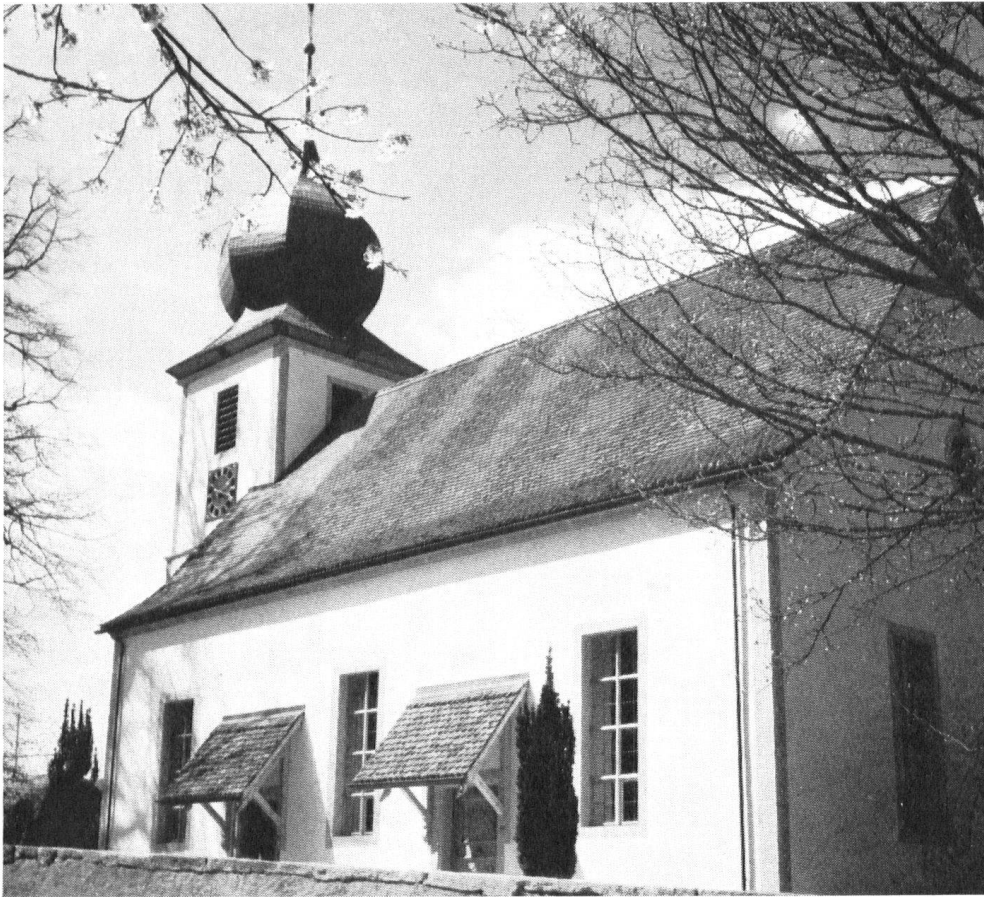
Sornetan, non loin de Bellelay, possède une église (celle-ci protestante) de l'époque baroque, dont le clocher pourvu d'un oignon se voit de loin.