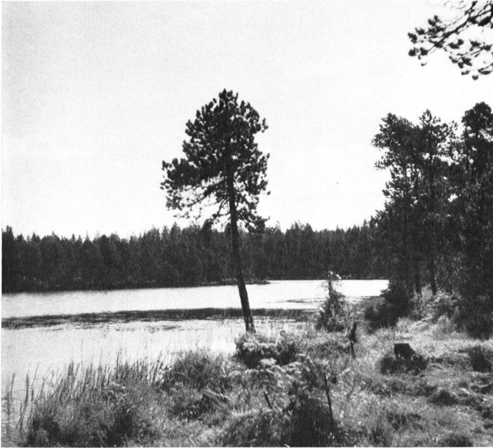
Autre vue de l'Etang de la Gruère. Paysage nordique. Outre les sapins et les pins, on y distingue le bouleau nain, témoin survivant de l'époque glaciaire.