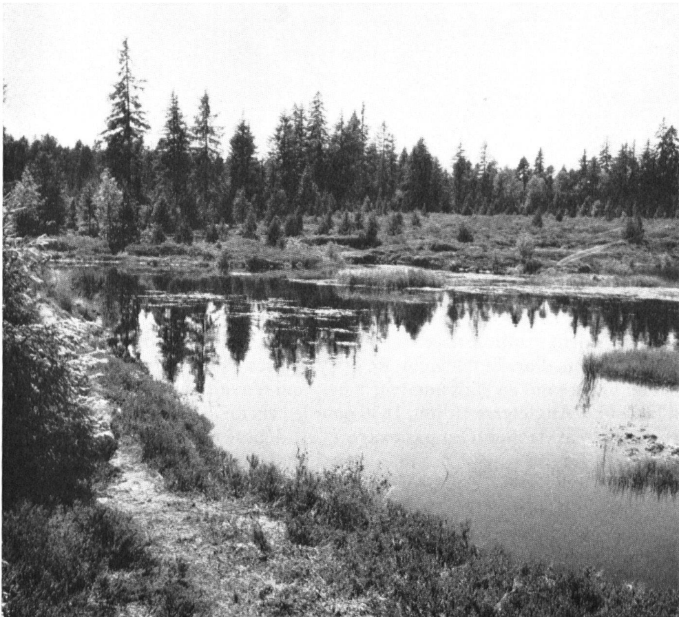
Encore une fois le marais de Gros Bois Derrière, dont le biotope doit être à tout prix préservé. Aussi la partie la plus précieuse, non accessible au public, est-elle entourée d'un redoutable barbelé. – Ailleurs aussi en Suisse, il faudra, pour la sauvegarde de la flore, établir des réserves totales.