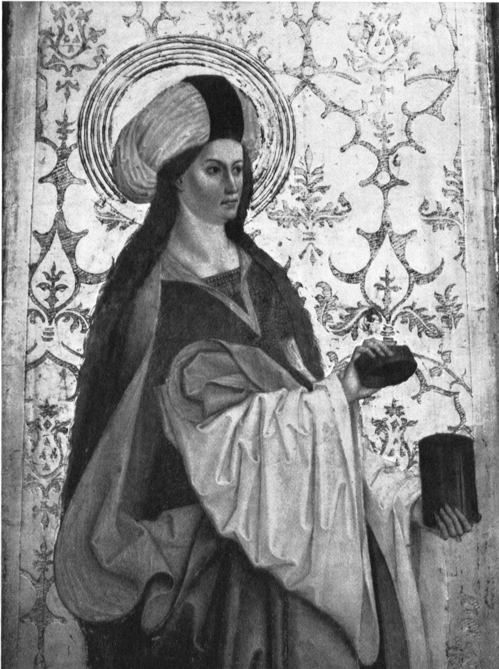
Maria Magdalena, Ausschnitt vom linken Altarflügel. Man kann sich einer gewissen Betroffenheit nicht erwehren im Wissen, dass ein solch ergreifend schönes Kunstwerk während mehr als zwei Jahrhunderten sozusagen unbeachtet verstaubte.

Luzerner Denkmalpfleger, vor, während sich dem Vorstand unsere bedeutendsten Kunsthistoriker zur Verfügung stellen. Der technologischen und kunstwissenschaftlichen Untersuchung öffnen sich die neuzeitlichsten Methoden mit Röntgen-, Infrarot- und Ultraviolettbestrahlung, mit einem ausgebauten physikalisch-chemischen Laboratorium und Mikrountersuchungen, von denen altväterisch-ländliche «Restaurierer» keine Ahnung haben dürften. Wir können es uns nicht mehr leisten, die unersetzlichen Kunstwerte vergangener Epochen dem erstbesten «Praktiker» anzuvertrauen; so werden denn die zahlreichen in- und ausländischen Kunstgeschichtsstudenten und Restauratoren im Zürcher Institut in handwerklicher, künstlerischer und kunstwissenschaftlicher Beziehung «ganzheitlich» ausgebildet, was auch dem Schweizer Heimatschutz Gewähr für beste Arbeit gibt.