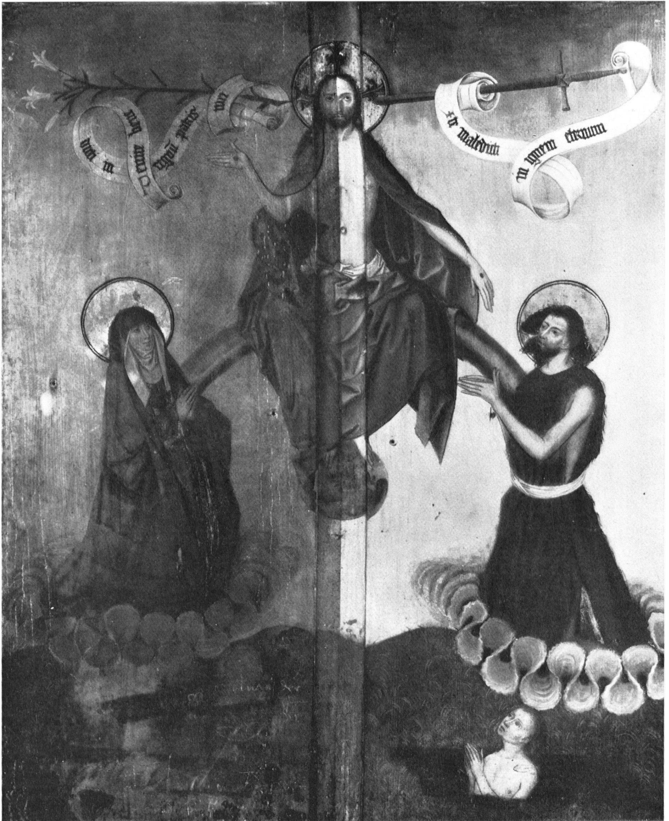
Bevor der spätgotische Altar aus Sontg Andriu abtransportiert wurde, hatte niemand Kenntnis von der packenden Trilogie auf der Rückseite des Schreins, die wir anhand einer Aufnahme des Instituts für Kunstwissenschaft «nach Halbzeit», d. h. nach zur Hälfte vorgenommener Restaurierung zeigen.