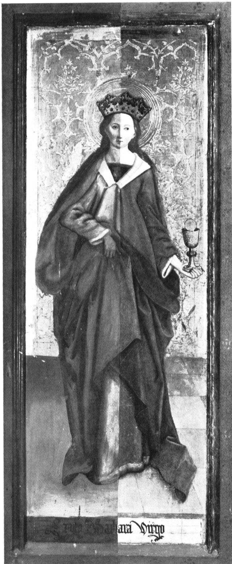
Nach der sorgfältigen Reinigung zeigte sich zunächst die rechte Hälfte des einen Altarflügels beinahe in der Eindrücklichkeit der Entstehungszeit (ca. 1490). Das Bild stellt die heilige Barbara mit dem Kelch der Märtyrerin dar.