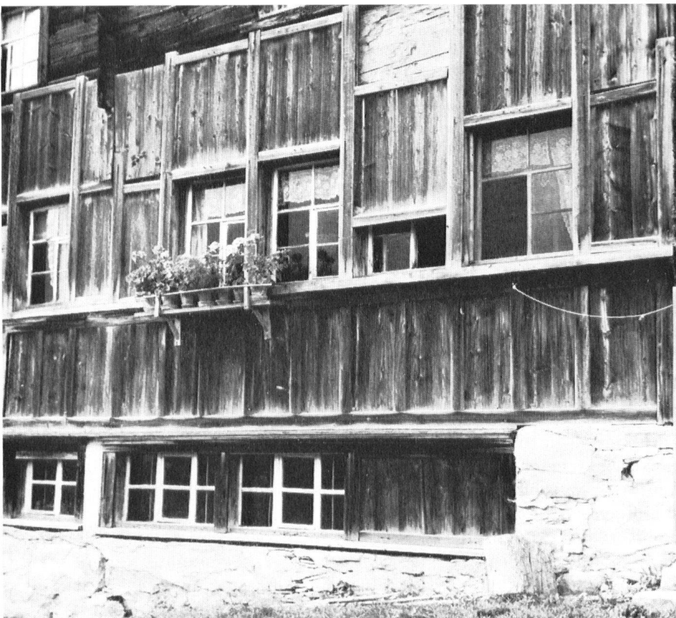
Bauernhaus mit Weber- keller. Zu beachten sind die hölzernen Schiebladen an oder über den Reihenfenstern.