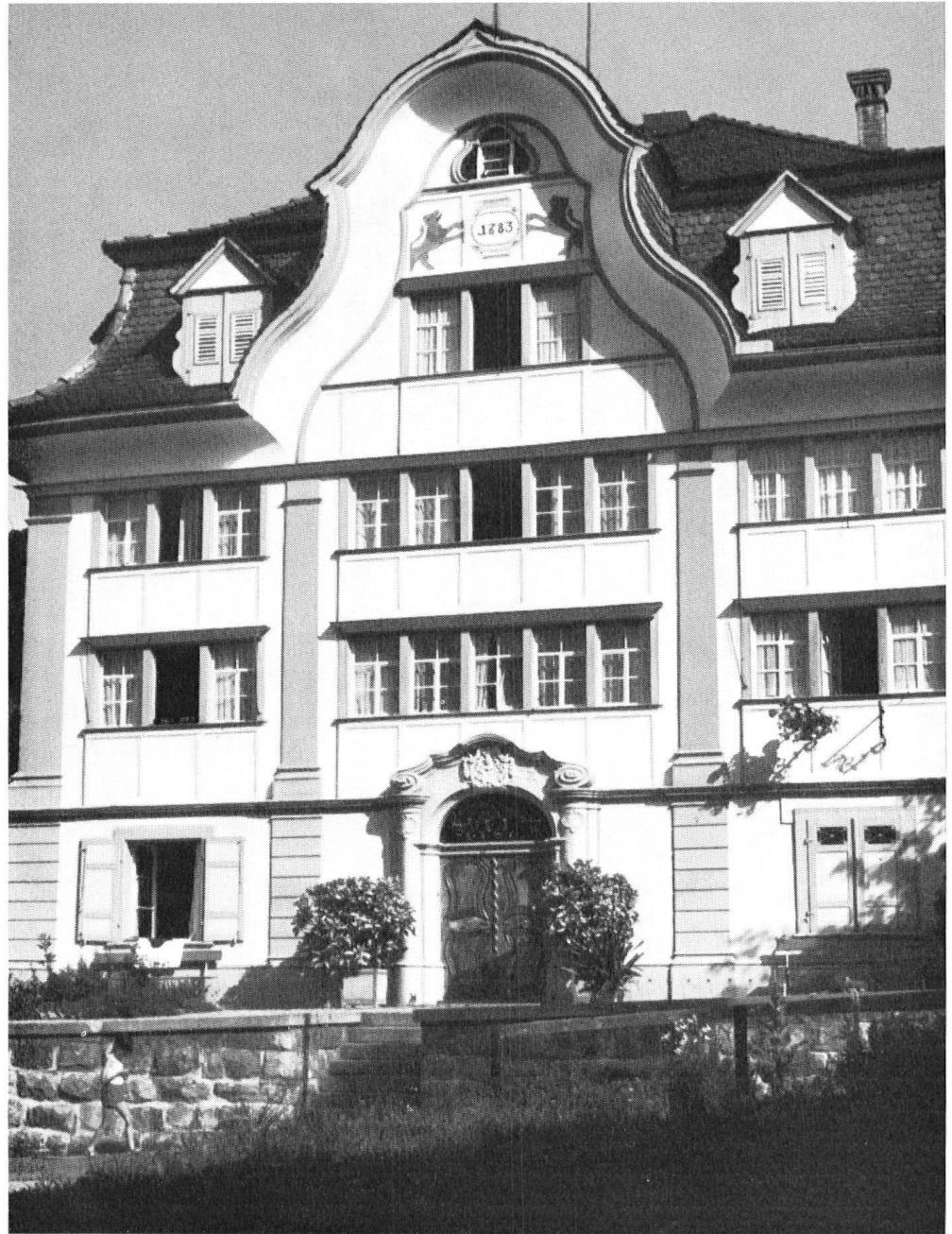
Barockes Haus von 1783 mit Kreuzgiebel und Mansardendach.

Von den 2731 «lokaltypischen» Bauten haben sich 1875 (69 Prozent) als Bauernhäuser erwiesen; bei 194 hat man die charakteristischen Einrichtungen vorgefunden, welche die Gebäude als Weberhäuser, bei 140 weiteren jene, welche sie als Stickerhäuser definieren lassen.