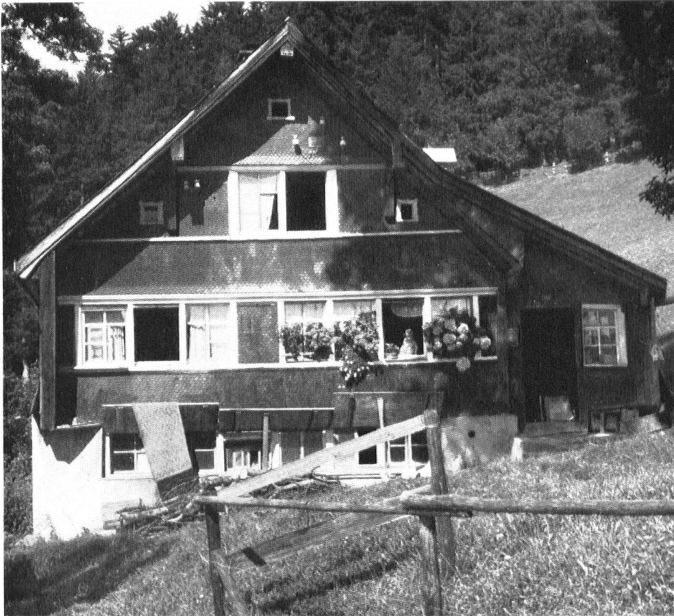
Charakteristisches Weberhäuschen. Im Untergeschoss der Weberkeller mit aufgeklappten Fensterladen.