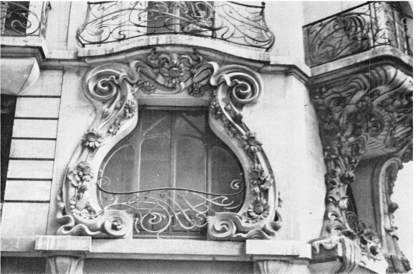
Detail einer der Fenstergestaltungen der «Maison des paons».

Intakt gebliebene Schaufensterfront; soweit sie nicht mehr vorhanden ist, soll im Erdgeschoss die Originalform der Schaufensterfassung wiederhergestellt werden.