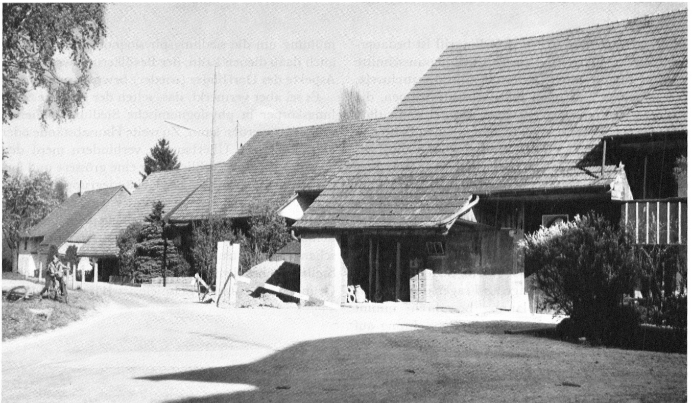
Niederbuchsiten SO, Kleinbauernhäuser an der Wolfwilerstrasse [unten] – Im Vergleich mit den Bauernhäusern im Dorfkern (oben) fallen bei diesen Bauten am Dorfrand die gedrungenen Grundrisse und der grosse Dachanteil auf. Das Charakteristikum dieser baulichen Einheit liegt auch nicht in der gemeinsamen Trauf- linie, sondern in einer eigentümlichen Staffelung der Häuser.