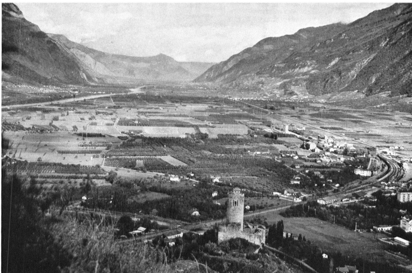
La vallée du Rhône vue de Martigny vers l'amont. Zone d'agriculture mécanisée, où s'est accomplie la grande mutation valaisanne (2e type).

celle-ci doit trouver place dans les endroits appropriés. Ce sont les zones des types 1 et 4 qui se prêtent aux expériences architecturales. Enfin, dans le paysage-type numéro 3, la petite industrie et les exploitations artisanales peuvent s'insérer en des lieux discrets (vallées).