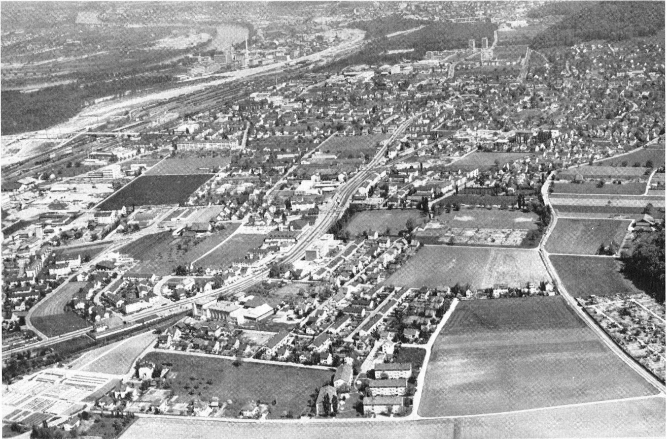
En haut: La banlieue de l'une des villes helvétiques. L'avenir nous réserve beaucoup d'autres banlieues aussi sinistres, si l'on tarde encore à planifier résolument.