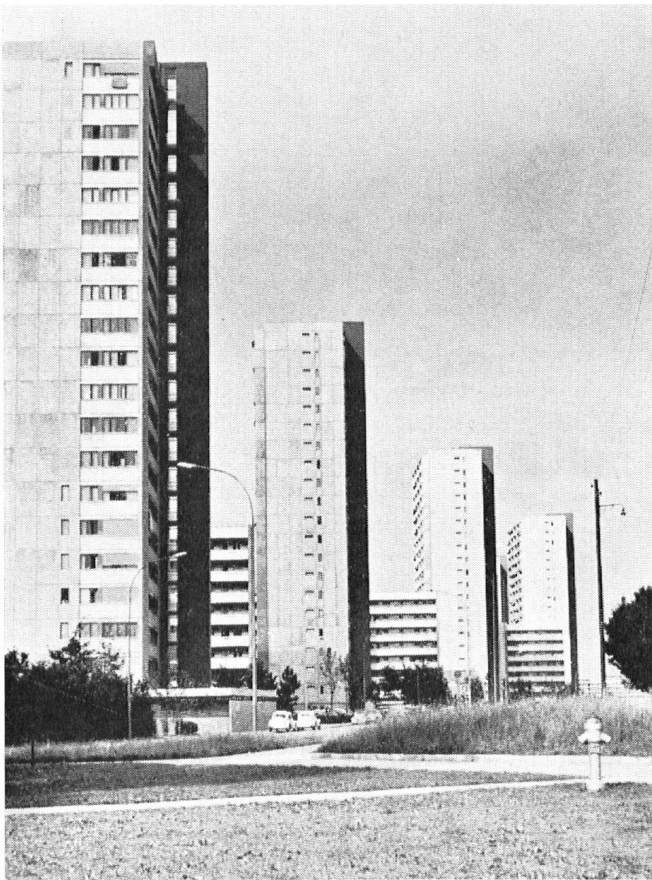
A gauche: Exemple de zone urbaine moderne.