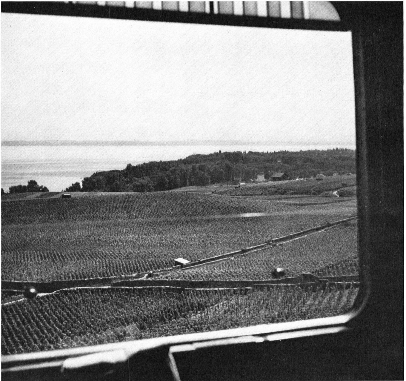
Zone cultivée du 3e type. Vignoble au bord du lac de Neuchâtel. Paysage harmonieux qu'on ne se consolerait pas de voir défiguré.

Page 81. Zones de grand tourisme (4e type), lesquelles requièrent aussi d'être limitées. — En haut: Les champs de ski d'été près du col St-Théodule que dominant les deux géants, Dent d'Hérens et Cervin. — En bas: La vaste station de Montana-Crans, exemple déplorable d'une expansion anarchique.