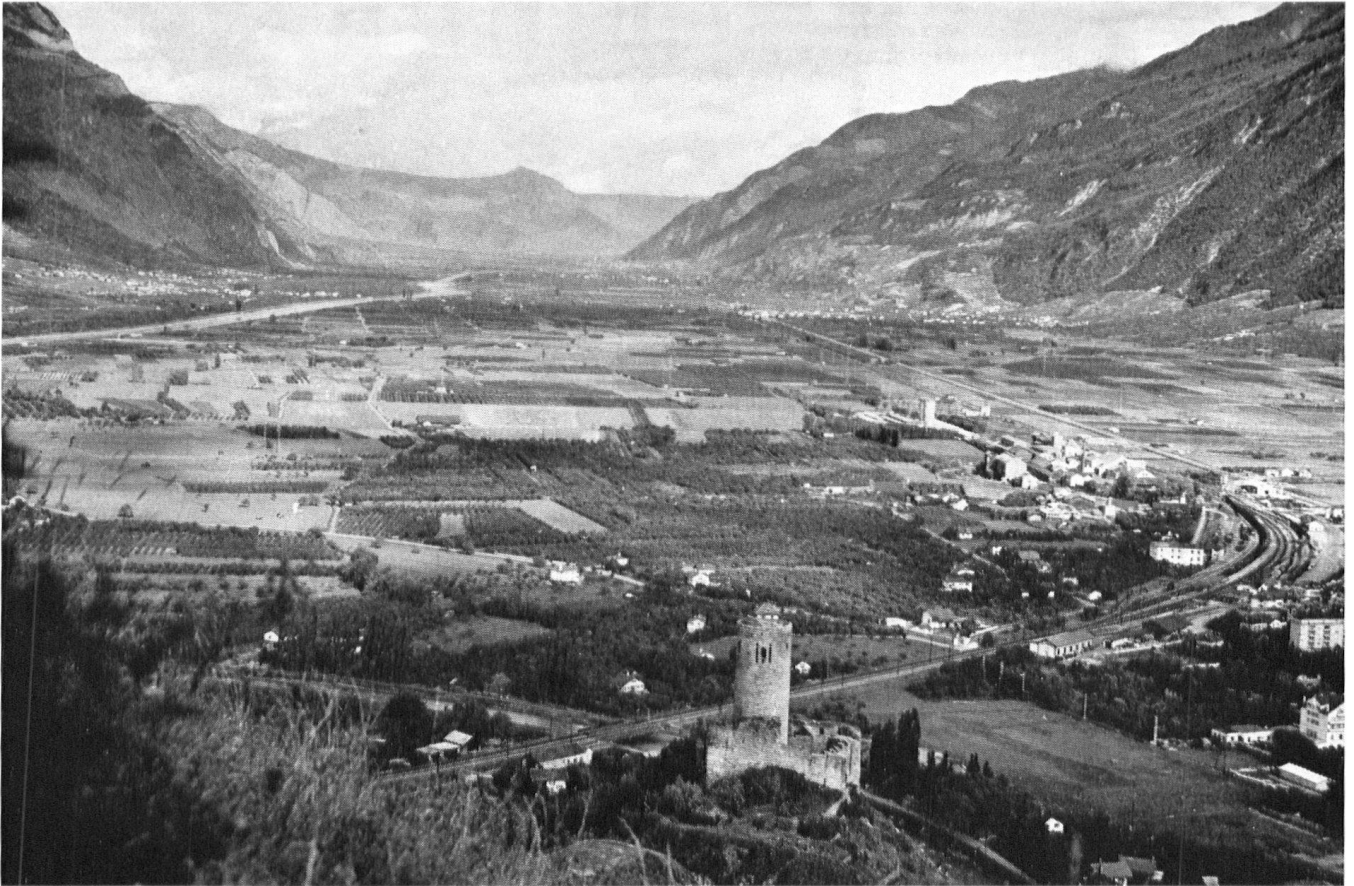
La vallée du Rhône vue de Martigny vers l'amont. Zone d'agriculture mécanisée, où s'est accomplie la grande mutation valaisanne (2e type).

celle-ci doit trouver place dans les endroits appropriés. Ce sont les zones des types 1 et 4 qui se prêtent aux expériences architecturales. Enfin, dans le paysage-type numéro 3, la petite industrie et les exploitations artisanales peuvent s'insérer en des lieux discrets (vallées).