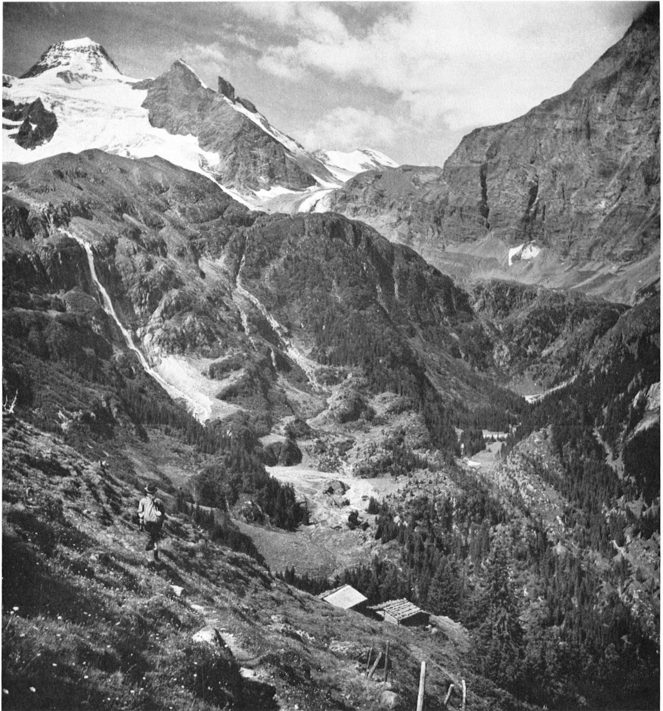
Paysage protégé (6e type), l'un des plus importants de la Suisse dans la haute vallée de Lauterbrunnen, où se trouve la cascade de Schmadribach; au dernier plan le Tschingelhorn.

ayant chacun une affectation différente, est celle de l'égalité économique. On la fait valoir surtout pour les territoires de montagne. En réalité, elle n'est pas convaincante. Car ce n'est pas le planiste qui procède en premier lieu à cette répartition, mais la nature elle-même. En général, dans notre pays, certaines ré-