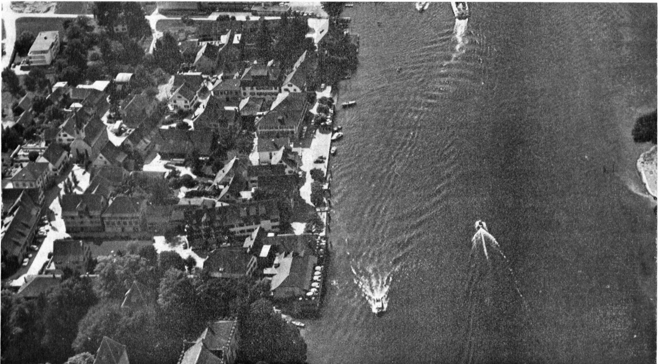
Gottlieben, am Rhein zwischen dem Bodensee und dem Untersee, stellt mit seiner «Drachenburg» und weiteren Riegelbauten ein erhaltenswertes Ortsbild in einer Landschaft von nationaler Bedeutung dar.