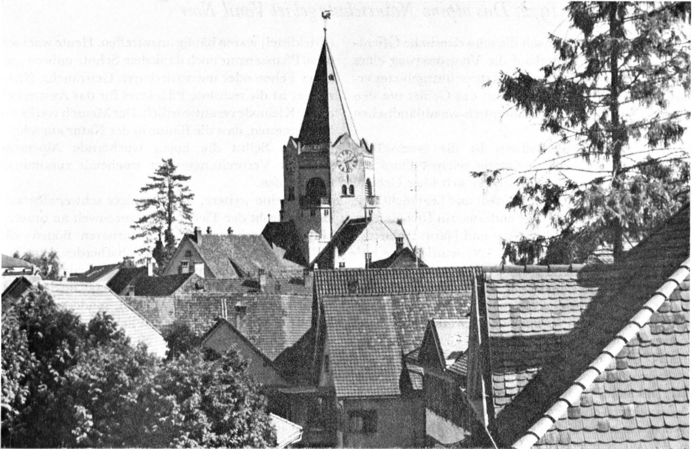
Die protestantische Kirche von Weinfeld, die als bedeutsames Werk des Jugendstils 1902/03 von Otto Pflughard und Max Häfeli in Zentralbauform errichtet wurde, ist von einem verunstaltenden Eingriff bedroht.