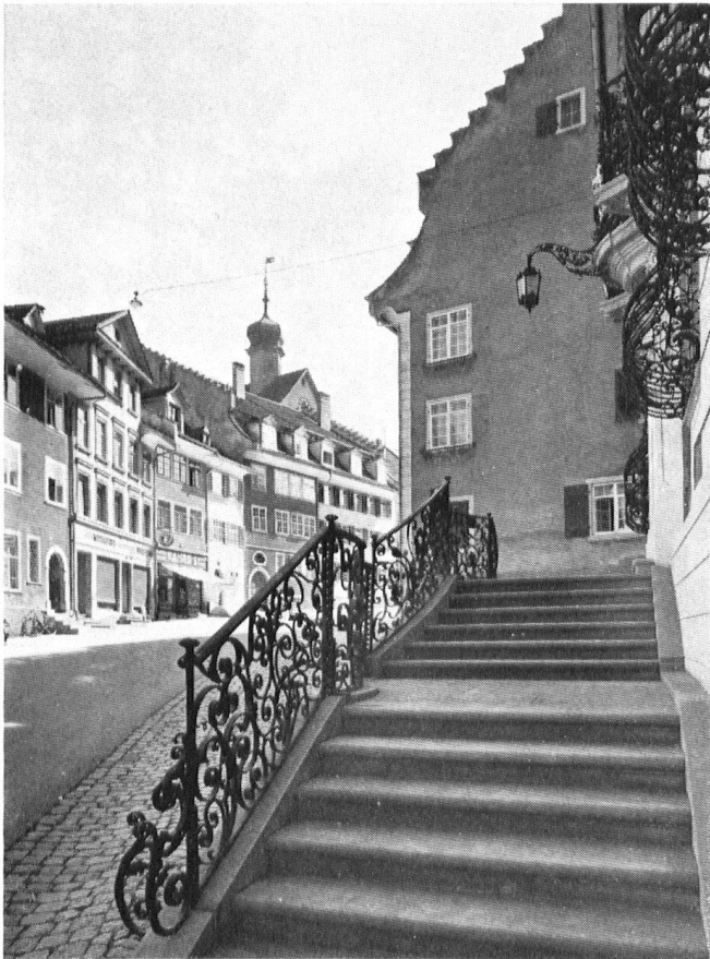
Bischofszell fut détruit en 1743 par un incendie. Ci-dessus, sa rue principale, bordée de belles demeures du XVIIIe, et à droite, l'Hôtel de ville, avec son escalier double.