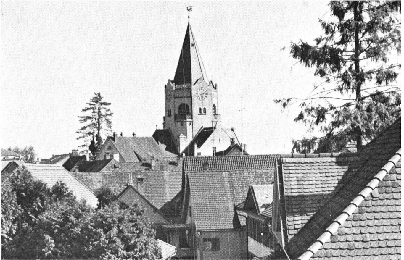
L'église protestante de Weinfelden, œuvre marquante du Jugendstil, fut construite en 1903. Il est question de lui faire subir une transformation importante.

Ci-dessous, Gottlieben, sur le Rhin, entre le Bodan et le Lac Inférieur, avec la Drachenburg et ses maisons à colombages, est un site villageois digne d'être protégé.