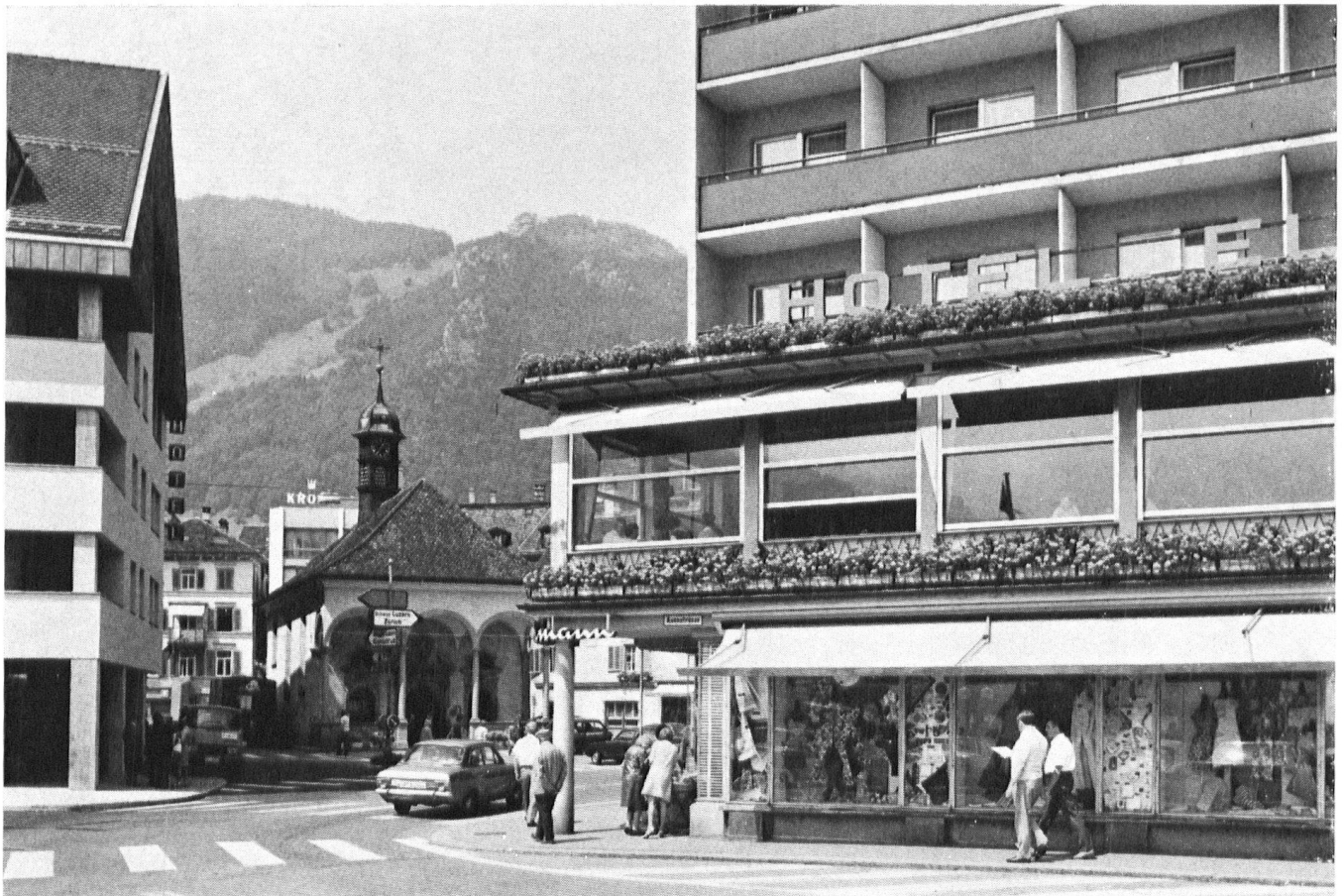
Der Dorfplatz von Brunnen SZ mit der sogenannten Bundeskapelle von 1632/35. Das barocke Bauwerk ist geschützt; doch was nützt dies, wenn es von viel zu voluminösen Nachbarn schier erdrückt wird? Das Haus links lehnt sich zwar mit seinem Satteldach an herkömmliche Formen an, wirkt aber in seinen Proportionen allzu mächtig.

hältnis von Shopping Center und Altstadt gibt es keinen treffenderen Vergleich als jenen mit dem menschlichen Herzen: Die Shopping Centers sind die Parasiten, die am Blutstrom einer Stadt saugen und ihren Herzschlag schwächen. Es ist irrig, zu glauben, man stehe diesem Problem machtlos gegenüber. Einkaufszentren entstehen nämlich juristisch gesprochen keineswegs «auf der grünen Wiese». In aller Regel ist die Voraussetzung für ihren Bau eine Änderung des betreffenden Zonenplanes, so dass es die Behörden sehr wohl in der Hand hätten, dieses Unheil von ihren Städten abzuwenden!