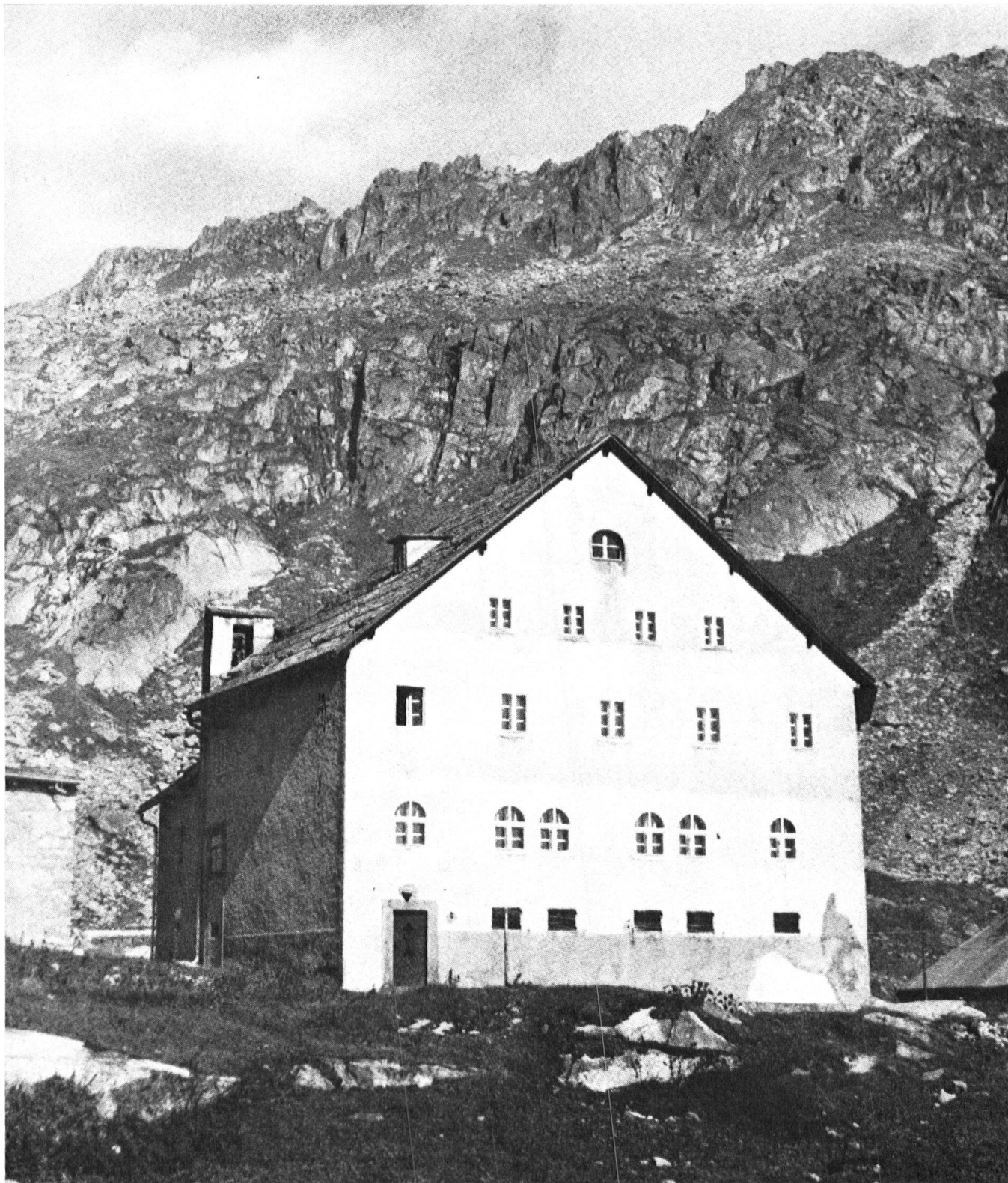
L'ancien hospice (tel qu'il se présente aujourd'hui).