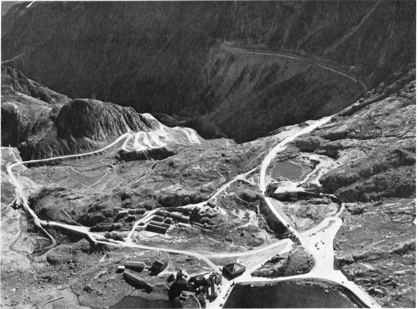
Vue aérienne, à comparer avec celle de la page 13. A gauche, l'ancienne route avec les lacets de la gorge de Tremola; à droite, la nouvelle route.