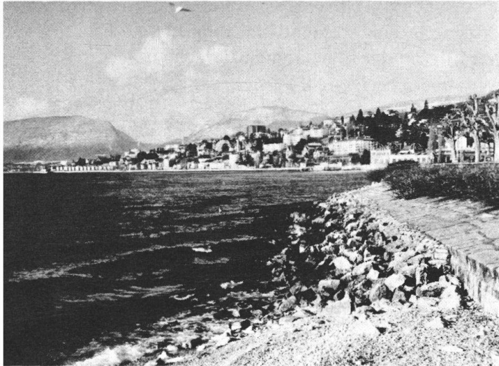
Von oben nach unten: Eine der prächtigen Alleen von Colombier wird durch den Bau der Autobahn kupt. – Längs dieser zum Teil aufzufüllenden Seebucht gedachten die Neuenburger Stadtbehörden die N 5 zu verlegen.

und den kleinen Hafen nach aussen verlegen. Dessen ungeachtet hat sich an dieser Stelle eine archäologische Tragödie ergeben. Zugegeben, der archäologische Dienst, der im Hinblick auf den Autobahnbau geschaffen worden ist, hat aufmerksam die Arbeiten verfolgt und die sich aufdrängenden Untersuchungen und Ausgrabungen mit Hilfe der staatlichen und weiterer Mittel pflichteifrig durchgeführt. Indessen war die zur Verfügung stehende Zeit ausserordentlich knapp. Man rettete, was möglich war, von den Funden zweier Pfahlbauersiedlungen, die, wie man vernimmt, die reichsten der ganzen Schweiz sein sollen. Es handelt sich um Siedlungen einerseits des ausgehenden Neolithikums (3. Jahrtausend vor Chr.), andererseits der Endphase der Bronzezeit (ca. 800 vor Chr.). Die überaus wertvollen Aufdeckungen werden zu 95% verloren sein, denn, so stellte