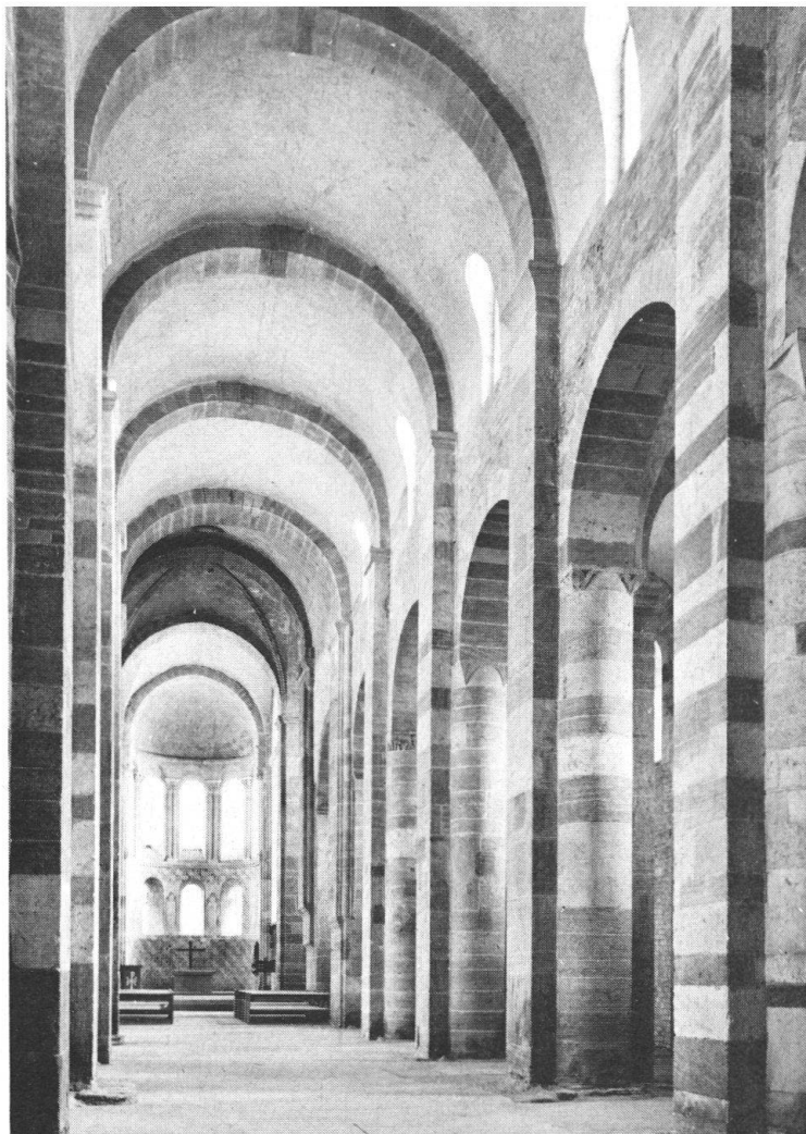
La haute nef de l'Abbatiale. A l'époque bernoise, un grenier y fut aménagé sur deux étages. En 1963, à l'occasion du millénaire de l'Abbatiale, l'église fut rendue au service divin en tant que «sanctuaire régional» (Photo Beutler, Payerne).

Dès le 21 mai 1562, date à laquelle elle avait été verrouillée par décision du Conseil de Payerne, l'ancienne église de l'abbaye avait connu des destinations diverses qui toutes lui avaient porté gravement atteinte. Elle avait tout d'abord abrité l'atelier d'un fondeur de cloches. En 1686, elle était devenue, par la grâce de Leurs Excellences de Berne, un vaste grenier occupant deux étages de planchers construits dans la nef et les bas-côtés. Au début du XIXe siècle, la Tour Saint-Michel, qui constitue le narthex de l'église, était vidée pour recevoir les prisons de district, alors que, dans les années 1860 et suivantes, on créait sous les voûtes romanes une caserne. On utilisa également l'Abbatiale comme salle de gymnastique, comme local des pompes et autre dépôt.