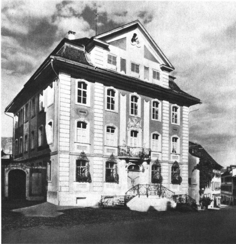
Bischofszell. Rathaus von Gaspare Bagnato (1750)