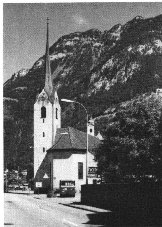
Seedorf. Pfarrkirche vor der Restaurierung (links). – Flüelen. Alte Pfarrkirche, profaniert und einer Wiederherstellung harrend