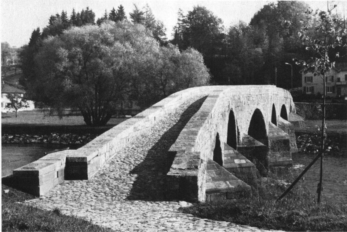
Bischofszell. Die mittelalterliche Thurbrücke (1478) nach der vollständigen Restaurierung.

Gleichzeitig wird jede Gemeinde ersucht, in ihrem Einflussbereich eine bestimmte Aufgabe anzupacken und zu lösen. Die Vorschläge reichen von einer Ausstellung der Stadtentwicklung gestern – heute – morgen, über den dringenden Rat, die Baulinien um die bestehenden Häuser (und nicht durch die Bauten) zu verlegen, bis zur Empfehlung, eine Brunnenanlage zu erstellen oder einen Baum zu pflanzen.