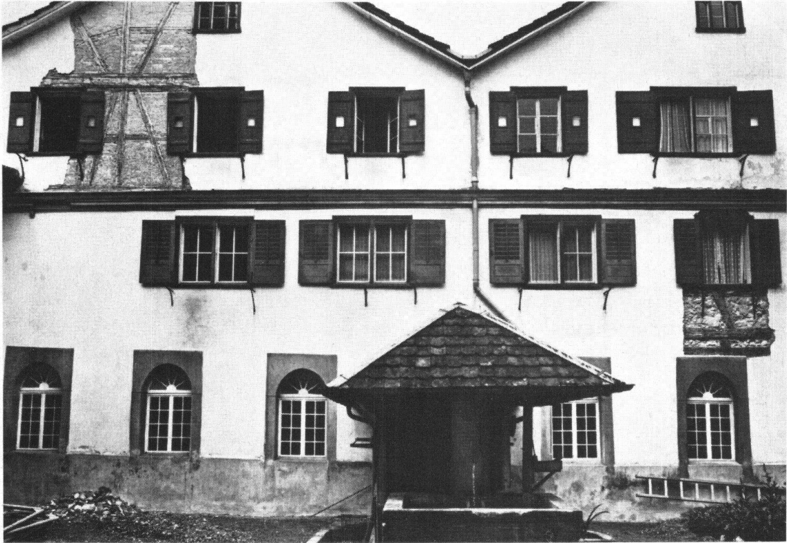
MAGDENAU SG. Zisterzienserinnen-Kloster. Die den Innenhof (Kreuzgang) umstehenden Gebäude sind grossenteils Riegelbauten. Unsere Bilder zeigen die Südseite des Innenhofes vor der Restaurierung mit dem verputzten Riegelwerk und die Nordseite nach der Restaurierung mit dem freigelegten und instandgesetzten Riegelwerk.