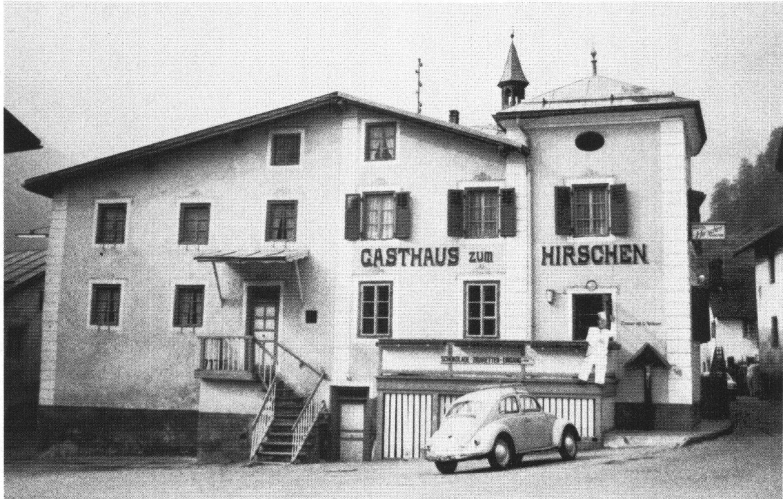
MÜSTAIR GR. Hotel Hirschen vor und nach der Restaurierung. Das den Platz Grund massgeblich prägende Gebäude ist im ersten Drittel unseres Jahrhunderts umgebaut und mit einem turmartigen Aufbau versehen worden. Bei der Fassadenrestaurierung von 1974 entdeckte man eine originale Sgraffitodekoration von 1613, welche wiederhergestellt wurde und die Rekonstruktion der ursprünglichen Fensterdisposition gestattete. Auf die ursprüngliche Dachneigung, die von der Dekoration markiert wird, konnte man aus Nutzungsgründen nicht zurückgehen.