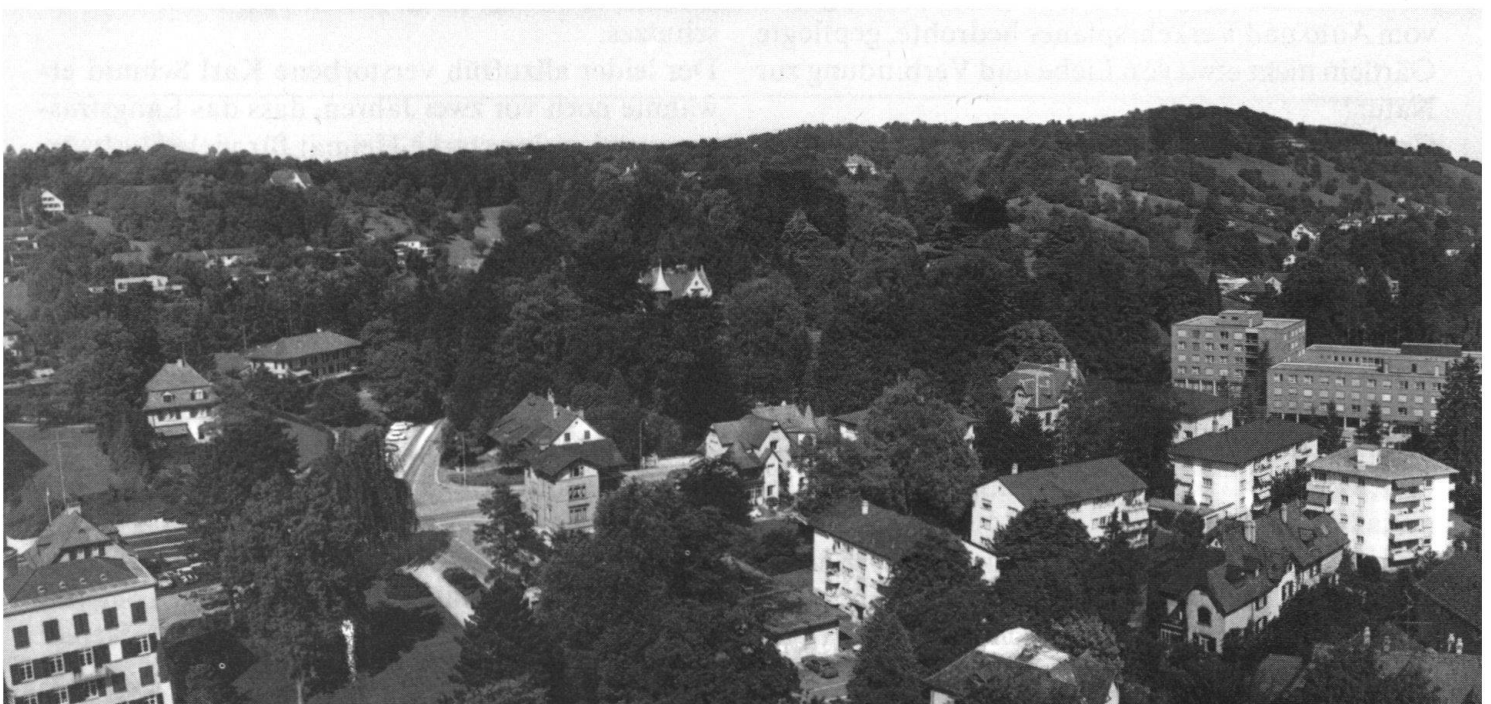
Bäume beherrschen das Bild der Industriestadt Winterthur.

mitwirkend, ist vollziehend, denn zugleich leben wir in einer Zeit, in der auf unerhörte Weise verschwendet wird. Das entspricht ihren beiden Tendenzen: der Nivellierung und der Beschleunigung. Das Hohe muss fallen, und das Alter verliert seine