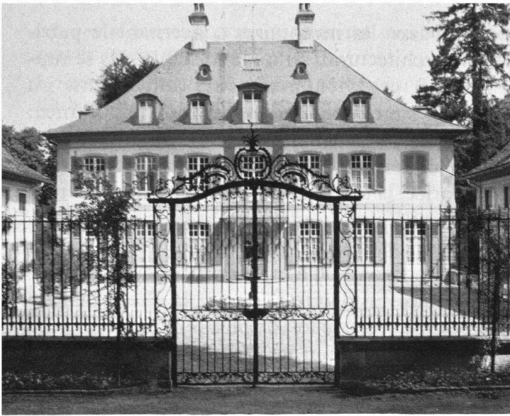
Le magnifique parc de la maison de campagne «Ebenrain», édifié vers 1770 près de Sissach BL, fut aménagé sur le modèle français, mais transformé plus tard dans le goût romantique.

née européenne du patrimoine architectural: du monument prestigieux et isolé, qui comme tel est de moins en moins menacé aujourd'hui, on a mis toujours davantage l'accent sur les ensembles architecturaux. Transposé dans le domaine des jardins, cela signifie que ceux des châteaux et manoirs ne doivent pas rester seuls au premier plan, mais qu'on doit aussi prendre en considération ceux des maisons bourgeoises, des villas, des fermes, soit parce qu'ils présentent certaines particularités ou quelque valeur historique, soit parce qu'ils constituent, de par leur fonction, un élément important d'une localité ou d'un paysage.