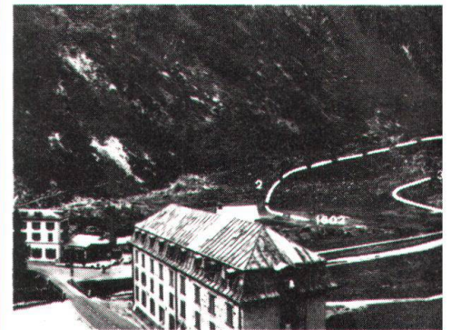
Beim Vollausbau des Pumpspeicherwerk-Projektes Gletsch käme das Hochbecken auf den Talboden zu liegen. Unser Bild zeigt das Gletschervorgelände um 1848 (Aquarell: H. Hogard) und 1970 und veranschaulicht deutlich die Bewegungen des Gletschers.

ten gleiche Leistungen erbringen können wie Kernkraftwerke. Deshalb ist bei einem nachgewiesenen zusätzlichen Spitzenenergiebedarf einer Pumpspeicheranlage unbedingt der Vorzug gegenüber einem Kernkraftwerk zu geben. Das Projekt Gletsch würde dem Wallis und vor allem dem wirtschaftsschwachen Goms Vorteile bringen (Konzessionsgebühren, Wasserzinsen, Arbeitsplätze usw.).