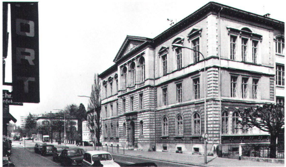
Die Höhere Stadtschule Glarus von der Hauptstrasse aus gesehen, im Hintergrund die Platzanlage am Spielhof mit dem Gerichtsgebäude und dem Mercier-Haus als Platzabschluss (Bild Aebli).

Glarus: Landrat fordert Heimatschutz heraus