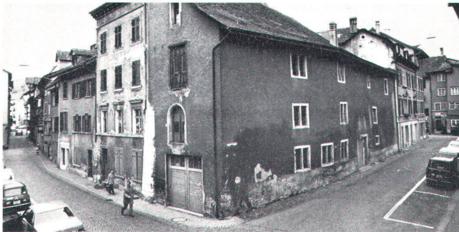
Hier an der Repfergasse in Schaffhausen sollte ein Neubau entstehen. Hinter den vernachlässigten Fassaden der dafür zu opfernden Altliegenschaften verbirgt sich eine kostbare Bausubstanz.

der Repfergasse ein. Zuvor hatte sie beim Bundesamt für Wohnungswesen technische Vorabklärungen getroffen, wurde aber von dieser Stelle belehrt, dass ihr Projekt den Mindestanforderungen des Wohnbau- und Eigentumsförderungsgesetzes nicht entspreche und deshalb überarbeitet werden müsse. Bevor an eine Subvention gedacht werden könne, sei überdies die Bedürfnisfrage abzuklären (in Schaffhausen herrscht ein grosses Überangebot an leeren Wohnungen!). Aber auch das dann später über den Kanton vorgelegte definitive Gesuch vermochte nicht zu überzeugen. Diesmal weil «das Projekt nicht in allen Teilen mit den für das Altstadtgebiet vorgesehenen Nutzungsvorschriften konform sei». Seither sind dem Bundesamt für Wohnungswesen weder die bereinigten Unterlagen noch ein neuer Bedarfsnachweis zugestellt worden, weshalb die Akten pendent gehalten werden.