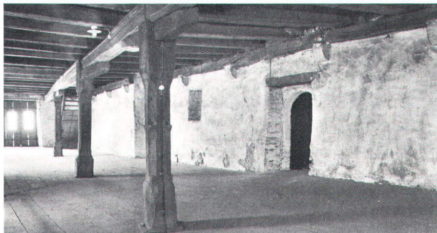
Im Innern des alten Kornhauses: nutzbare Räumlichkeiten von hoher Bauqualität.

Im Auftrag des Schaffhauser Heimatschutzes hat deshalb die Architektengemeinschaft Tissi und Götz eine Alternativstudie erarbeitet, die es bei geringeren Investitionskosten erlauben würde, das vorhandene Raumangebot zu erhalten, zu sanieren und in Form von Werkstätten, Lagern, Büros, Läden und Wohnungen zu nutzen. Aufgrund dieses Sachverhalts holt nun das Bundesamt für Wohnungswesen über die Eidgenössische Natur- und Heimatschutzkommission ein Gutachten über den umstrittenen Neubau ein, das entweder dazu führen wird, das bestehende Projekt abändern oder aber in Zusammenarbeit mit Heimatschutz und Denkmalpflege ein neues Projekt entwickeln zu lassen. Würde der Gesuchsteller darauf nicht eintreten, könnte er wohl oder übel weder aus dem Wohnbauförderungsfonds noch aus Denkmalpflegemitteln Bundeshilfe erwarten. Marco Badilatti