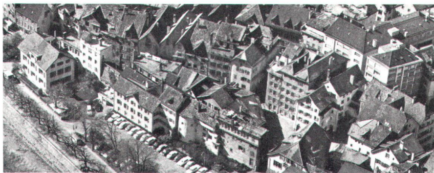
Der Arcas vor (oben) und nach der Neugestaltung (Projektskizze unten). Indem die mittlere Häuserreihe entfernt wurde, gewann der Architekt Raum für den Marktplatz.