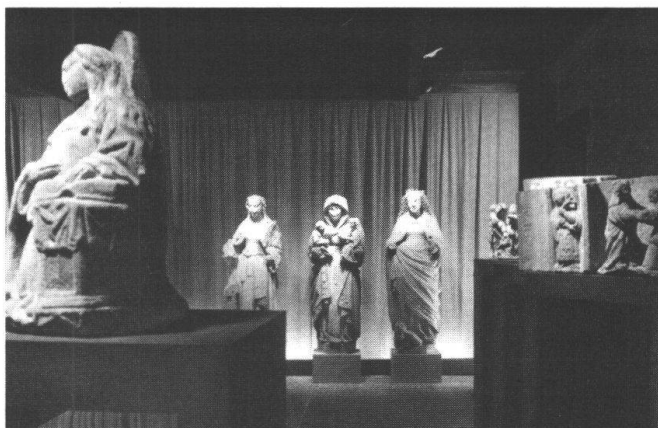
Die wirtschaftliche Konzentration begünstigt auch im kulturellen Bereich Ungleichgewichte zwischen den einzelnen Landesteilen und benachteiligt die Minderheiten. Mit dem von den Initianten vorgeschlagenen Kulturartikel soll die Kulturförderung harmonisiert werden. Unser Bild zeigt einen Ausschnitt aus dem Kathedralen-Museum von Lausanne.

Die Antwort muss von einer Prüfung des Bestehenden ausgehen. Die Eidgenossenschaft gibt jedes Jahr einen Teil ihrer Gelder für den Natur- und Heimatschutz sowie den Schutz der Kulturgüter, für die Pro Helvetia und andere Aktivitäten aus. Der Bund hat die Entscheidungsfreiheit der Universitäten nicht eingeengt, obwohl er sie finanziell unterstützt. Und wenn im Parlament ob der Kul-